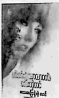
ဇလပ်နီစာပေတိုက်