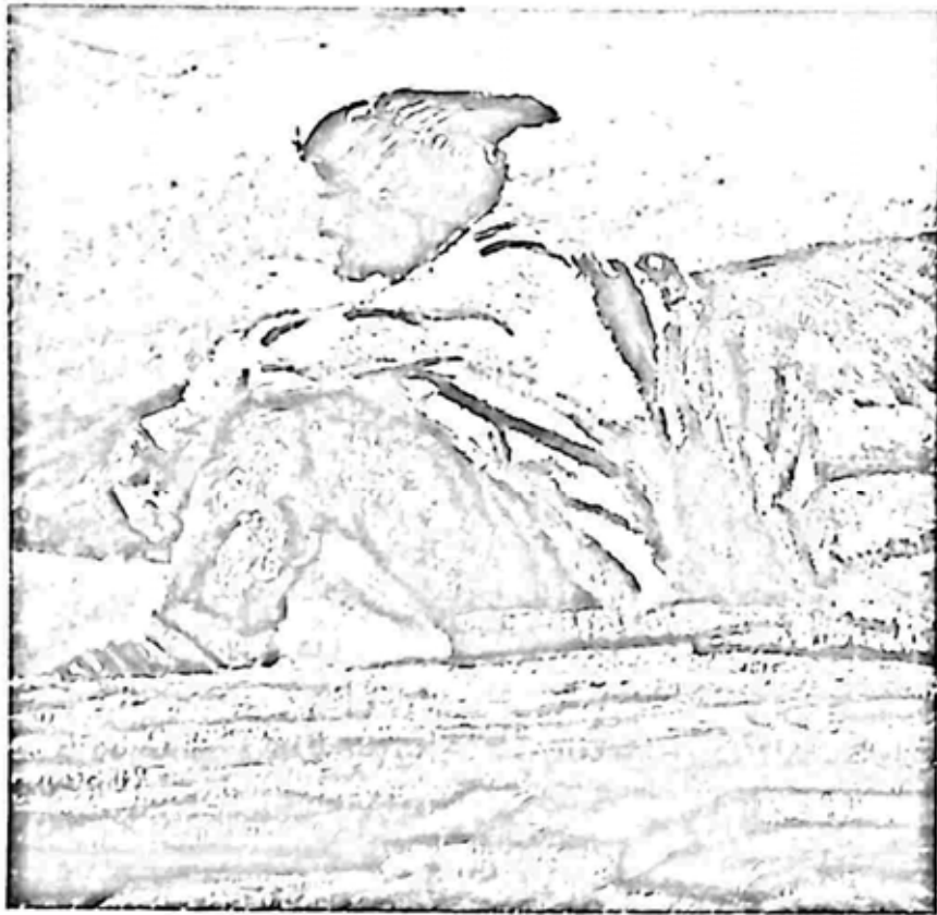
လပ်နီစာပေ