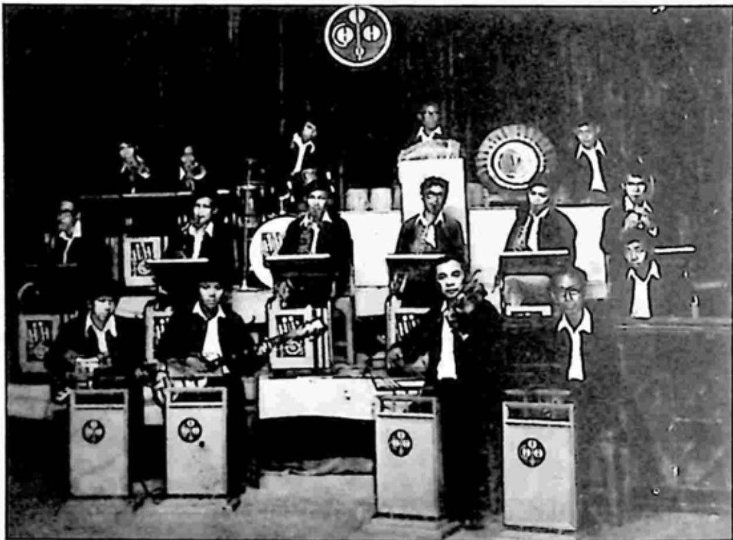
မြို့မ ဗုဒ္ဓဝေယျာဝစ္စ တူရိယာအသင်း