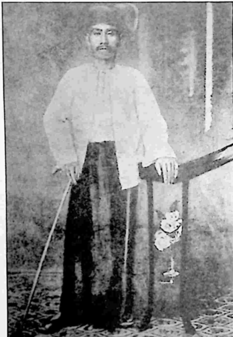
တောင်သူလယ်သမား အရေးတော်ပုံကို ဦးဆောင်ခဲ့သူ ဂဠုန်ဆရာစံ

ရွှေဘိုခရိုင်ဇာတိဖြစ်ပြီး ဆရာစံက ၁၉၂၈ ခုနှစ်မှစ၍ သူပုန်ထရန် ရည်ရွယ်ချက်ရှိခဲ့သည်ဟု သဘောရရှိသော်လည်း ၁၉၃၀ ပြည့်နှစ်ကျမှ ၎င်းက သာယာဝတီတွင် အခြေချနေထိုင်ခဲ့သည်' စသည်ဖြင့် ရေးသားဖော်ပြထားပါသည်။