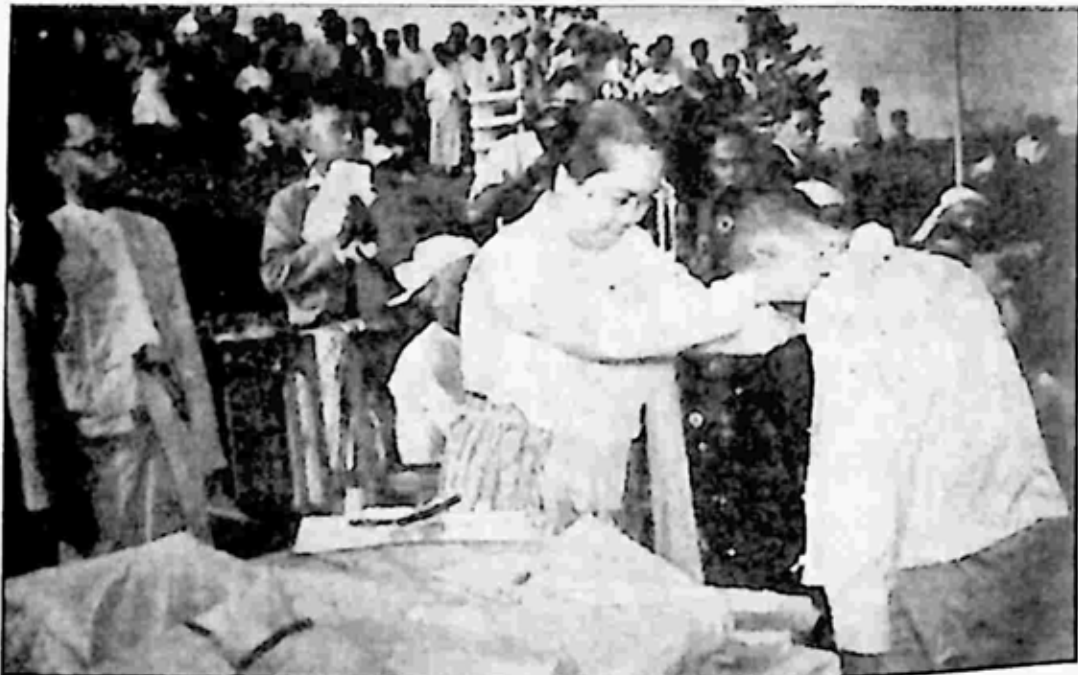
ဗိုလ်ချုပ်ကတော် မဟာသီရိသုဓမ္မဒေါ်ခင်ကြည်က ကမ္ဘာ့ကလေးများနေ့ အခမ်းအနားတွင် ဆုရရှိသူ ကလေးများအား ဆုချီးမြှင့်နေစဉ်။

ကမ္ဘာ့ကလေးများနေ့ အခမ်းအနားကို လွတ်လပ်ရေးရရှိပြီး နောက် ပိုင်းကာလတွင် မြန်မာနိုင်ငံ၌ စတင်ကျင်းပခဲ့ရာ၌ နိုင်ငံအများစုက ကမ္ဘာ့ ကုလသမဂ္ဂမှ ထုတ်ပြန်သည့်အတိုင်း နှစ်စဉ် အောက်တိုဘာလ ပထမ တနင်္လာနေ့တွင် ကျင်းပကြသည်။ မြန်မာနိုင်ငံတွင် ၁၉၅၅ ခုနှစ် ကျင်းပ စဉ်ကလည်း ထိုသို့ပင် ကျင်းပခဲ့သည်။ သို့သော် ကမ္ဘာ့ကုလသမဂ္ဂ အဖွဲ့ကြီး အနေဖြင့် နိုင်ငံအလိုက် သင့်တော်ရာနေ့တွင် ကျင်းပကြရန် ခွင့်ပြုခဲ့ရာ မြန်မာ နိုင်ငံက ဗိုလ်ချုပ်အောင်ဆန်း မွေးနေ့ကို ကမ္ဘာ့ကလေးများနေ့အဖြစ် သတ်မှတ်ခဲ့ကြခြင်း ဖြစ်ပါသည်။