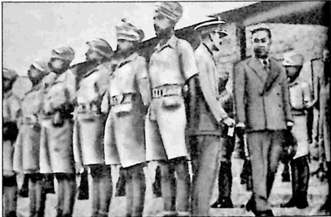
နန်းရင်းဝန် ဂဠုန်ဦးစော အိဂျစ်ပြည်သို့ရောက်ရှိစဉ်။

ဖေဖော်ဝါရီလ ၂၀ ရက်နေ့တွင် ဦးပု ညွန့်ပေါင်းအစိုးရ တက်လာ ခဲ့သည်။ ဂဠုန်ဦးစောသည် ယင်းအစိုးရအဖွဲ့တွင် သစ်တောရေးနှင့် လယ်ယာ စိုက်ပျိုးရေးဝန်ကြီးအဖြစ် ပါဝင်ခဲ့သည်။ သို့သော် တစ်နှစ်ကျော်အကြာ ၉၊ စက်တင်ဘာ၊ ၁၉၄၀ တွင် ဦးပုအစိုးရကို ဖြုတ်ချကာ ဂဠုန်ဦးစော နန်းရင်းဝန် ဖြစ်လာခဲ့သည်။