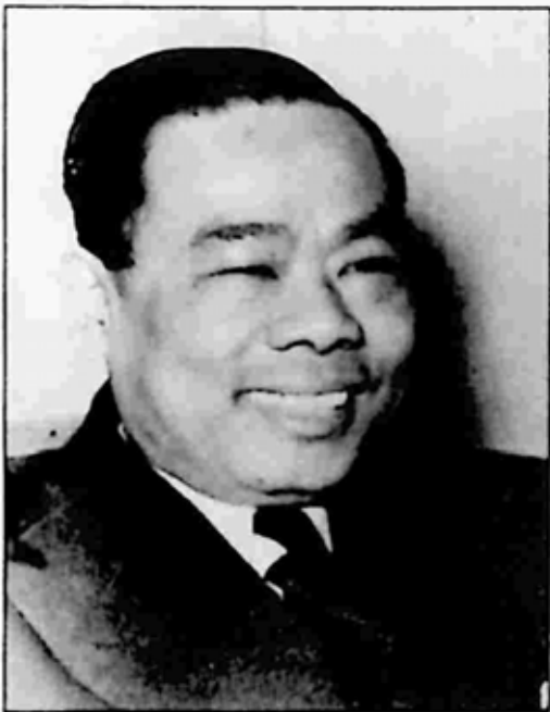
နန်းရင်းဝန် ဂဠုန်ဦးစော

ဗိုလ်ချုပ်အောင်ဆန်းတို့အား လုပ်ကြံခဲ့သည့် တရားခံများအနက် နံပါတ် ၁ ဖြစ်ခဲ့သူ ဂဠုန်ဦးစောသည် တစ်ကြိမ်က နန်းရင်းဝန်ရာထူး ရရှိ ခဲ့ဖူးပါသည်။ ဂဠုန်ဦးစောသည် ပင်ကိုအားဖြင့် အရည်အချင်းရှိသူတစ်ဦး