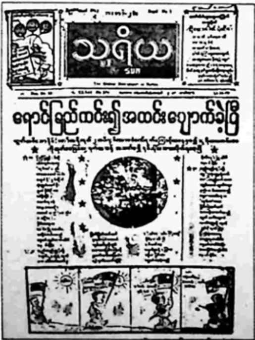
၁၃-၁၁-၄၉ နေ့ထုတ် သူရိယသတင်းစာ