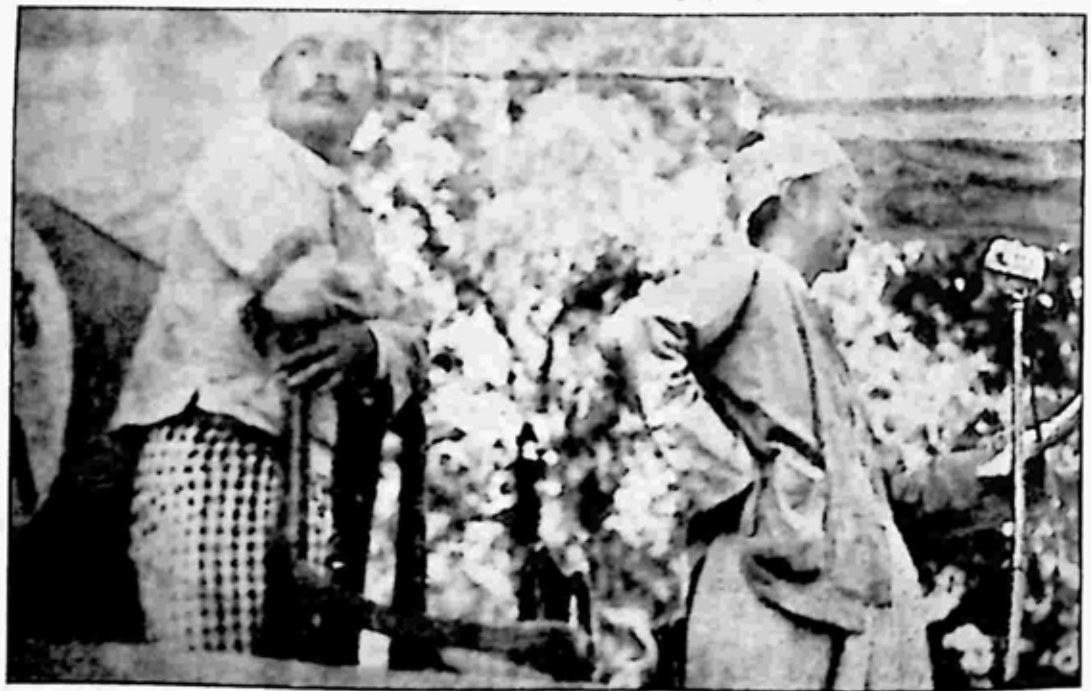
တို့ဗမာအစည်းအရုံး နာယက သခင်ကိုယ်တော်မှိုင်းနှင့် ဥက္ကဋ္ဌတို့အား တရားဟောစင်မြင့်ထက်၌ တွေ့ရှိရစဉ်။

တိုင်းပြည်ရေးကိစ္စ ရေးသားရာတွင် အလွန်ခွဲသန်သော မဂ္ဂဇင်း ဖြစ်ကြောင်း၊ ယခင် တစ်လတစ်ကြိမ် ထုတ်ဝေရာမှ နှစ်ပတ်တစ်ကြိမ် ဖြစ်