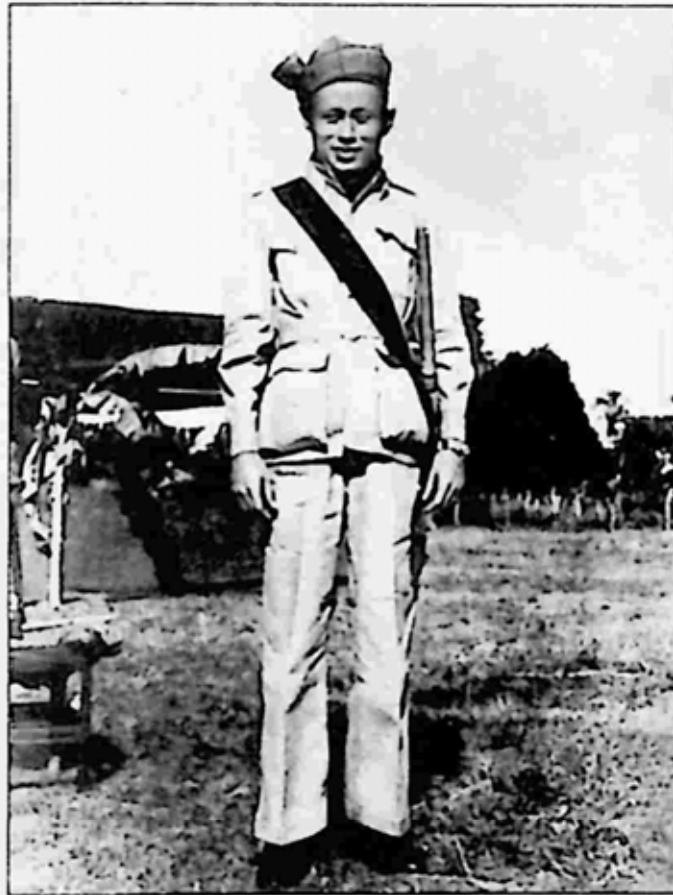
ဗိုလ်ချုပ်အောင်ဆန်းအား ကချင်တိုင်းရင်းသားဝတ်စုံဖြင့် တွေ့ရှိရပုံ။

သည်။ ထိုအခါ ယင်းအသံကိုကြားသည်နှင့် အားလုံးက ထောက်ခံ သဘော တူလိုက်ကြသည်။ မဏ္ဍပ်တွင် တာဝန်ကျနေသော ကချင်တိုင်းရင်းသူ အမျိုး သမီး ၆ ဦးက ဗိုလ်ချုပ်အောင်ဆန်းနှင့်အတူ အမှတ်တရဓာတ်ပုံရိုက်ကြရန် ဝိုင်းဝန်းတောင်းဆိုပြီး မဏ္ဍပ်တွင်းမှ ထွက်လာကြသည်။