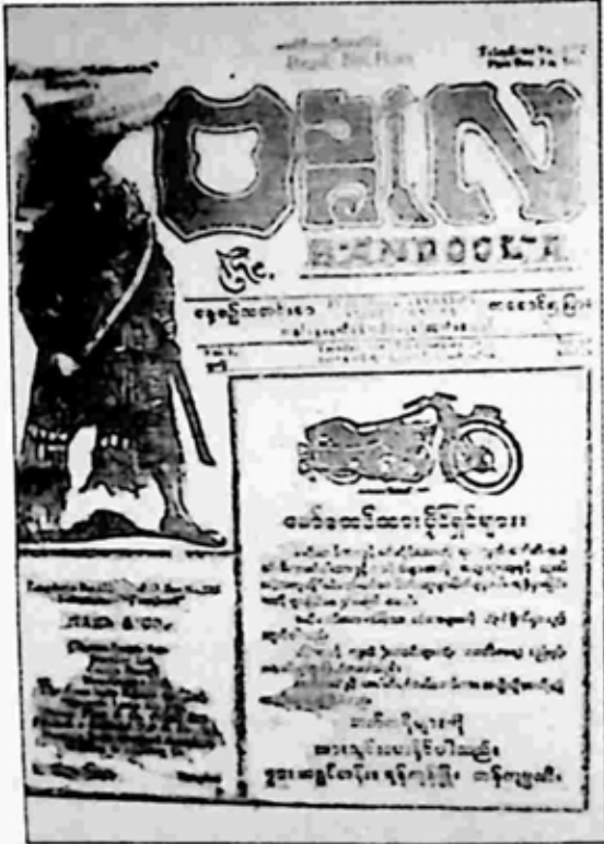
ဗန္ဓုလဂျာနယ်နှင့်အပြိုင် ထုတ်ဝေခဲ့သည့် ဗန္ဓုလသတင်းစာ။

ဗန္ဓုလဂျာနယ်တွင် နှစ်စဉ် မြန်မာနှစ်သစ်ကူးချိန်၌ တစ်နှစ်အတွင်း ထင်ရှားသော ပြည်တွင်း ပြည်ပ အဖြစ်အပျက်များကို စုစည်းကာ နေ့စဉ်မှတ်တမ်း ကဏ္ဍအဖြစ် ဖော်ပြပေးပါသည်။ ဥပမာအားဖြင့် ၁၂၉၂ ခုနှစ် (၁၉၃၀) အတွက် ဒိုင်ယာရီတွင် 'နှစ်ဆန်း ၁ ရက်နေ့ - မန္တလေး၌ လေကြီးကျ၍ အတော်အတန် ပျက် စီး သည်။ က ဆုန်လဆန်း ၉ ရက် - မဟာတ္ထမဂန္ဓိကို အစိုးရဖမ်းဆီးသည်။ ၎င်းနေ့ ည အောက်မြန်မာပြည် ငလျင်ကြီးလှုပ်ရာ ပဲခူးမြို့ ပျက်သည်။ ရန်ကုန်မြို့၌လည်း တိုက်တွေ့ပြီ။ လူတွေ သေကြသည်' စသည်ဖြင့် ဖြစ်သည်။