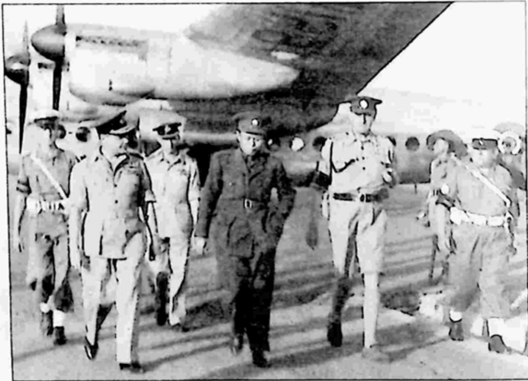
ဗိုလ်ချုပ်အောင်ဆန်းနှင့်မြန်မာကိုယ်စားလှယ်များ မြန်မာပြည်သို့ ပြန်လည်ရောက်ရှိကြစဉ်။

အသွင်ကို ဆောင်နေလေသည်။ သူ၏စိတ်တွင်းမှာ ဘယ်လိုနေသည်ကို အသာကလေးဝင်၍ ချောင်းကြည့်လိုက်ရလျှင် အလွန်ကောင်းပေမည် ဟု ရေးသားထားပါသည်။