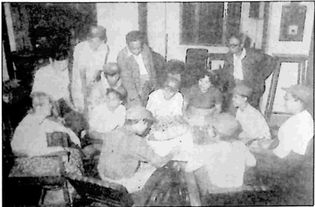
၁၉၇၃ ခုနှစ် သန်းခေါင်စာရင်း ကောက်ယူနေစဉ်။

ထိုစဉ်က သန်းခေါင်စာရင်း ကောက်ယူရာတွင် လူဦးရေဆိုင်ရာ စာရင်း၊ အိုးအိမ်ဆိုင်ရာစာရင်း၊ စိုက်ပျိုးရေးဆိုင်ရာစာရင်း၊ စက်မှုလက်မှု