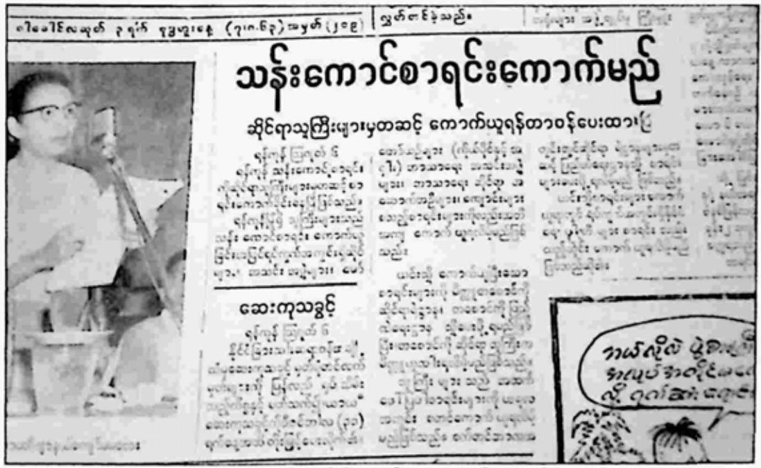
သတင်းစာပါ သန်းခေါင်စာရင်း ကောက်ယူမည့်သတင်း။

မြန်မာနိုင်ငံ လွတ်လပ်ရေးရရှိခဲ့ပြီးနောက် မြန်မာနိုင်ငံ ဖွံ့ဖြိုးတိုးတက်ရေးအတွက် ဆောင်ရွက်ရာတွင် တိုင်းပြည်၏ လူဦးရေစာရင်း တိကျစွာ ရရှိရေးသည်လည်း အရေးပါလှပေရာ ၁၉၅၁ ခုနှစ်ကပင် သန်းခေါင်စာရင်း မင်းကြီး ဦးကျော်ခိုင် ခေါင်းဆောင်လျက် စာရင်းကောက်ယူနိုင်ရန် ကြိုတင်ပြင်ဆင်ခဲ့ကြသည်။ ယင်းသန်းခေါင်စာရင်းကောက်ယူရန် ပုံစံတွင် ဘာသာစကား၊ စစ်မဖြစ်မီ နေရပ်နှင့် စစ်ပြီး နေရပ်၊ နေထိုင်ရာ အိမ်အရွယ်ပုံစံ၊