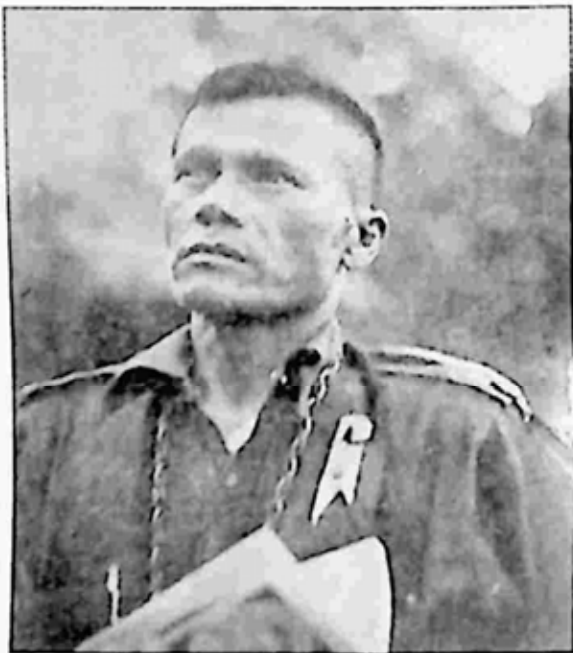
အာဠာဝက သခင်ဘိုးလှကြီး

သခင်ဘိုးလှကြီး၏ လည် ပင်းထက်တွင် သံကြိုးဆွဲထား သည်ဟု အထင်ရှိကြသော်လည်း စင်စစ်အားဖြင့် သပိတ်တပ် ချီ တက်စဉ် ဝီစီချိတ်ဆွဲရန် ဂုန်နီအိတ် ကြိုး ဆွဲထားသည်ကို မသင့်တော် သဖြင့် ဇနီးဖြစ်သူက သိုးမွေးကြိုး ထိုးပေးလိုက်ခြင်းသာ ဖြစ်ပါသည်။