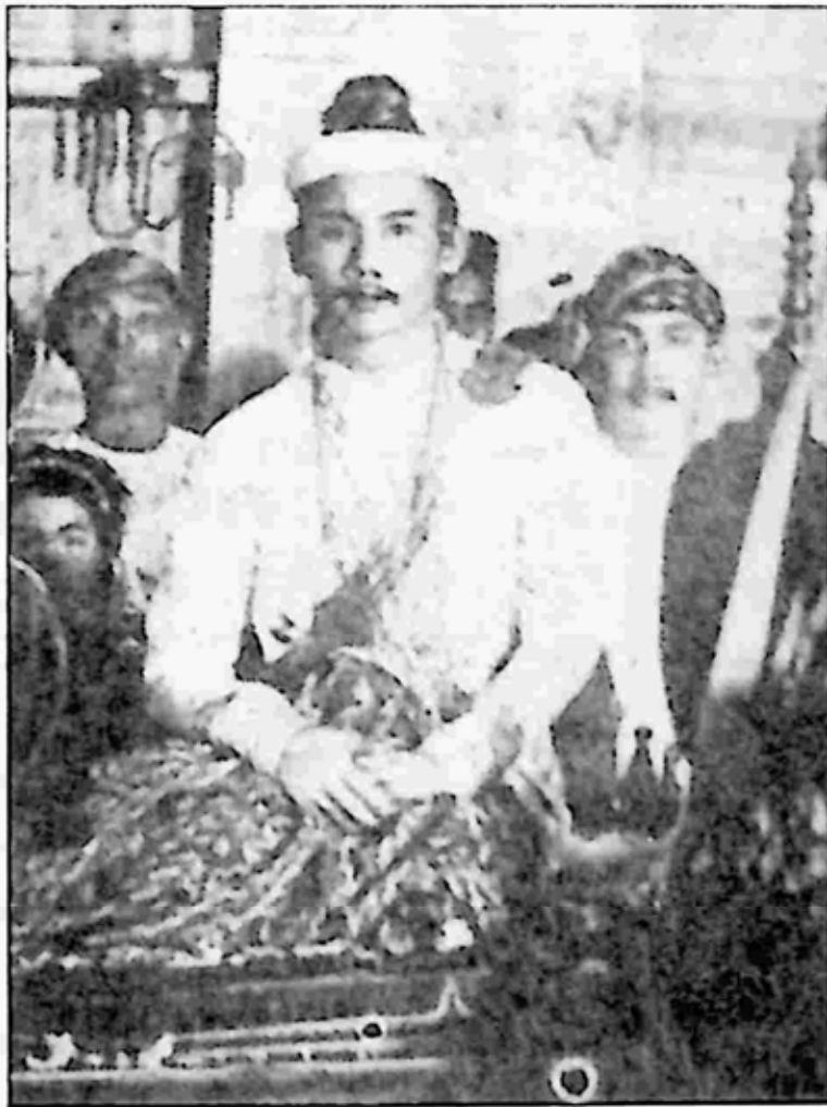
သခင် ထိပ်တင်ကိုယ်တော်ကြီး