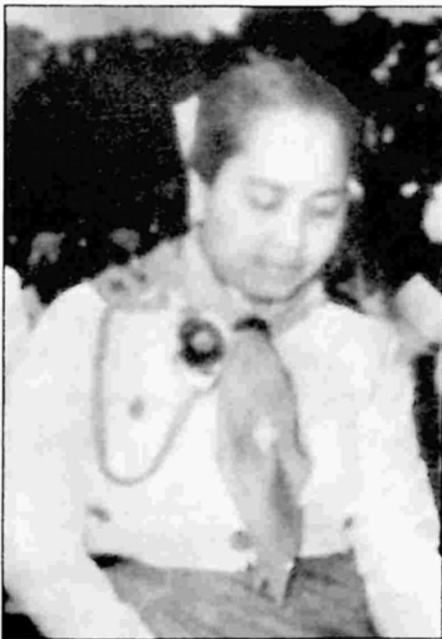
ကလေးသူငယ် စောင့်ရှောက်ရေးကောင်စီဥက္ကဋ္ဌ ဗိုလ်ချုပ်ကတော် ဒေါ်ခင်ကြည်

ကမ္ဘာ့ကလေးများနေ့ အခမ်းအနားတွင် အခမ်းအနားမှူးအဖြစ် လူမှု ဝန်ထမ်းကော်မတီ အတွင်းရေးမှူး ဦးဘခင်က ဆောင်ရွက်ခဲ့သည်။ နံနက်