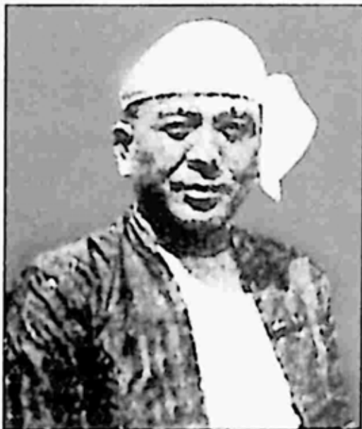
ဗန္ဓုလဂျာနယ်ကို ဦးစီးထုတ်ဝေခဲ့သူ ဗန္ဓုလဦးစိန်

ဒုတိယကမ္ဘာစစ် မဖြစ်မီက မြန်မာ့စာနယ်ဇင်းလောကတွင် သက်တမ်း အရှည်ဆုံးနှင့် စောင်ရေအများဆုံး ထုတ်ဝေရောင်းချခဲ့ရသည့် ဂျာနယ်အဖြစ် ဗန္ဓုလဂျာနယ်ကို သတ်မှတ်ခဲ့ကြသည်။