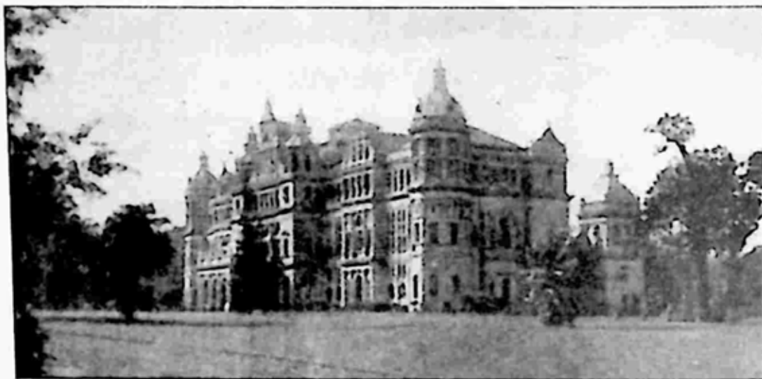
ဘုရင်ခံအိမ်တော်

မကြာမီ တိုင်းခန်းလှည့်လည်ရင်း သာယာဝတီ ဒီစကြိုတ်ကောင်စီ ဧည့်ခံပွဲ သို့ တက်ရောက်ခဲ့သည်။ ဒီစကြိုတ်ကောင်စီ လူကြီးများက ဘုရင်ခံ လာ ရောက်စဉ် ဆက်သသော သြဘာစာ၌ နိုင်ငံပြည်သူတို့ ကြည်ဖြူစွာ မပေး လိုကြသည့် သဿမေနှင့် လူခွန်တော်ကို ဖျက်သိမ်းသင့်ကြောင်း အကြံပြု ခဲ့ကြသည်။