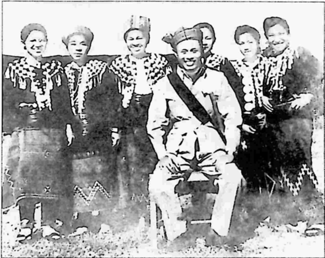
ဗိုလ်ချုပ်အောင်ဆန်းနှင့် ကချင်တိုင်းရင်းသူကလေးများ အမှတ်တရရိုက်ကူးထားသောဓာတ်ပုံ။

အမှတ်တရ လက်ဆောင်ပစ္စည်း ပေးအပ်ရေး တာဝန်ယူခဲ့ရသူလည်း ဖြစ်သော ဒေါ်ဂေါ့လူလုမှာ နောင်တွင် ပြည်နယ်ပညာရေးမှူးအဖြစ် တာဝန်ထမ်းဆောင်ရာမှ အငြိမ်းစားယူခဲ့ပါသည်။