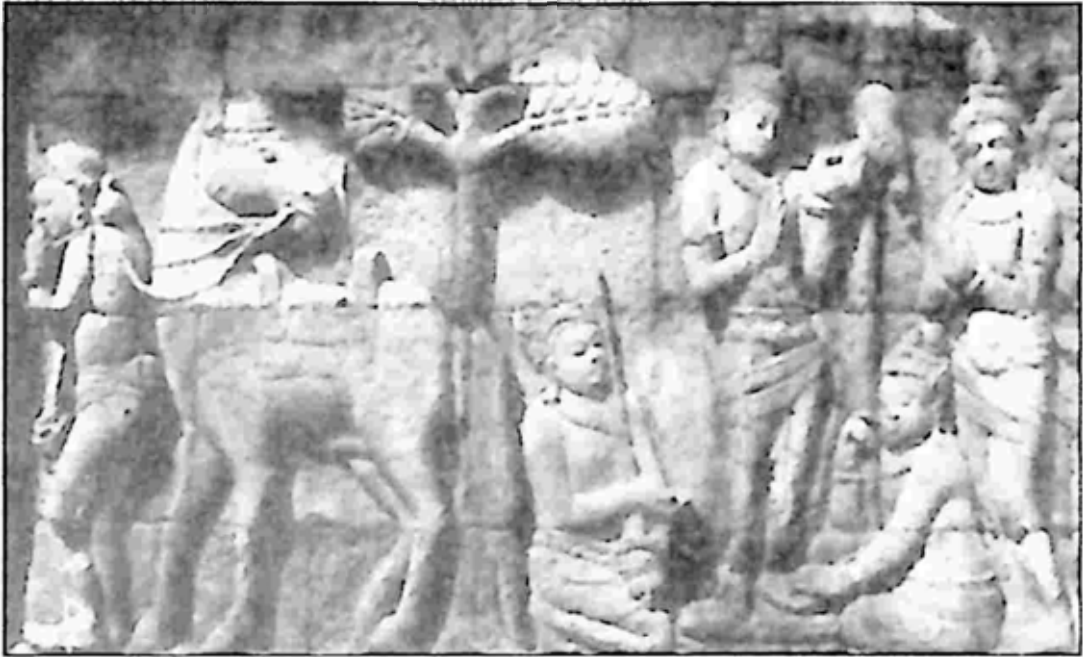
ပုံ ၃။ ဆန္ဒအမတ်ကို ဗုဒ္ဓလောင်းလျာ ပြန်လွှတ်ခန်း။ ဗောဓိပုဗ္ဗေဝေတီ ရုပ်ကြွ၊ အေဒီ ၈ ရာစု။

မြစ်တစ်ဖက်ကမ်း အရောက်တွင် မင်းသား အဆောင်အယောင်များကို ချွတ်၊ ဆံကိုဖြတ်၊ ရဟန်းအဝတ်ကို ဆင်၏။ အဖော်ပါလာသူ ဆန္ဒ အမတ်နှင့် ကဏ္ဍက မြင်းတို့ကိုလည်း ကပိလဝတ်သို့ ပြန်လွှတ်၏။ ထိုသူတို့မှာ မင်းသားစကားကို မပယ်နိုင်။ ကပိလဝတ်သို့ ဝမ်းနည်းပန်းနည်း ပြန်ကြရလေသည်။ (ပုံ ၃)