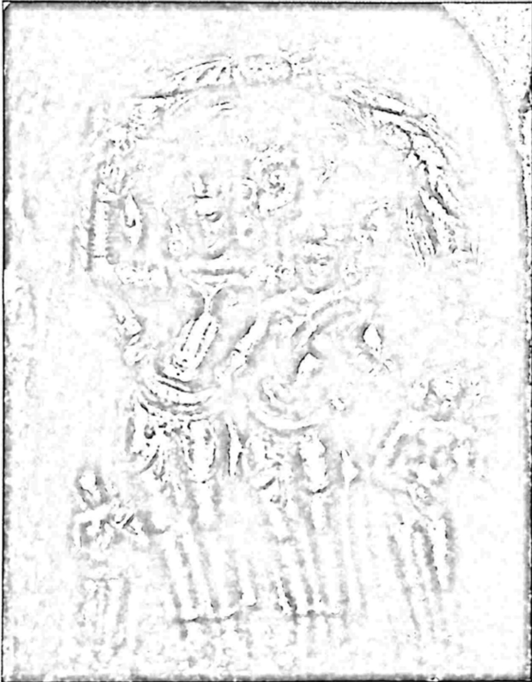
ပုံ ၁။ မယ်တော်မာယာ သားဖွားခန်း၊ ပုဂံ အာနန္ဒာ ဂူဘုရား။