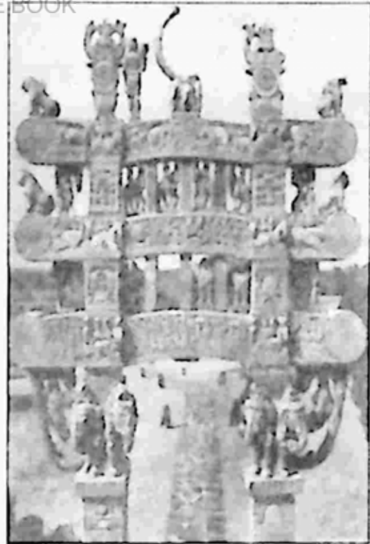
ပုံ ၁၂။ ဆန်ချိုထူပါ အမှတ် ၁။ အရှေ့ဘက် တုရိဏ်တိုင်။

ထိုထူပါတံခါး မုခ်တုရိဏ်တိုင်များ (ပုံ ၁၂) တွင်လည်းကောင်း၊ ဂူနံရံများတွင်လည်းကောင်း၊ ဗုဒ္ဓဖြစ်စဉ် ရုပ်ဖောင်း ရုပ်ကြွများနှင့် ဆေးရေးပန်းချီများ၊ တောတိရစ္ဆာန်ရုပ်များမှ စ၍ နတ်ဒေဝါရုပ်၊ ယက္ခရုပ်များ အထိ အခြံအရံ ရုပ်ပုံများ ဆင်ယင်ထားရှိလေသည်။