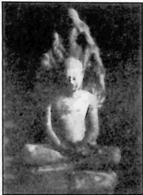
ပုံ ၆။ နဂါးရုံဘုရား၊ မုဗ္ဗန္တုဒ္ဓ၊ ကမ္မေဒနိင်ငံ။

ဤသည် ဘုရားအဖြစ်သို့ ရောက်သည်နှင့်တစ်ပြိုင်နက် ဂေါတမ