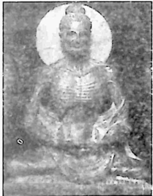
ပုံ ၄။ ဗုဒ္ဓလောင်းလျာ ဒုက္ကရစရိယာကျင့်ခန်း ဂန္ဓာရ၊ လာဟိုပြတိုက်၊ အေဒီ ၂-၄ ရာစု။

ဗုဒ္ဓလောင်းလျာသည် ၆ နှစ် တိုင်တိုင် တရားရှာလေသည်။ တရားရှာသည့်အမှုတွင် အာဠာရ ရသေ့နှင့် ဥဒက ရသေ့တို့ထံတွင် နည်းခံသည့် အခါလည်း ရှိပေ၏။ သို့ရာတွင် ဗုဒ္ဓလောင်းလျာမှာ တရားထူး မရ။ ဈာန်သမာပတ်အကျိုးသာ ထင်လေသည်။ ထိုအခါ ဥရဝေလတောတွင်းသို့ ဝင်၍ ဒုက္ကရစရိယာကျင့်လေသည်။ (ပုံ ၄)