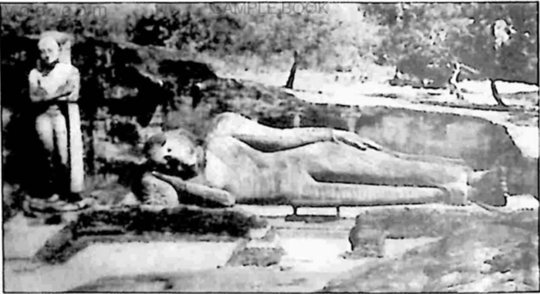
ပုံ ၈။ ဗုဒ္ဓ ပရိနိဗ္ဗာန် ဝံခန်း၊ သီဟိုဠ်နိုင်ငံ၊ ပေါင်္ဂရာရဝဒေသ၊ အေဒီ ၁၂ ရာစု။

အပေါင်း ဖူးမြော် သံဝေဂယူနိုင်သော ဌာနများဖြစ်ကြောင်း ညွှန်ပြလေသည်။