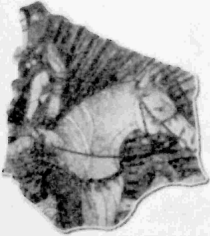
ပုံ ၂။ ဗုဒ္ဓလောင်းလျာ တောထွက်ခန်း။ ချောချွတ်ဒေသ၊ အေဒီ ၁၀ ရာစု။

ထိုစိတ်များသည် ယခု အသက် ၂၉ နှစ်အရွယ်တွင် ပို၍ ဖိစီးလာ တော့သည်။ ညတစ်ညတွင်မူ မိဘနှင့် သားမယားကို အသိမပေးဘဲ အဖော်တစ်ယောက်၊ မြင်းတစ်စီးဖြင့် အနော်မာမြစ်ဘက်သို့ ထွက်ခွာခဲ့ လေသည်။ (ပုံ ၂)