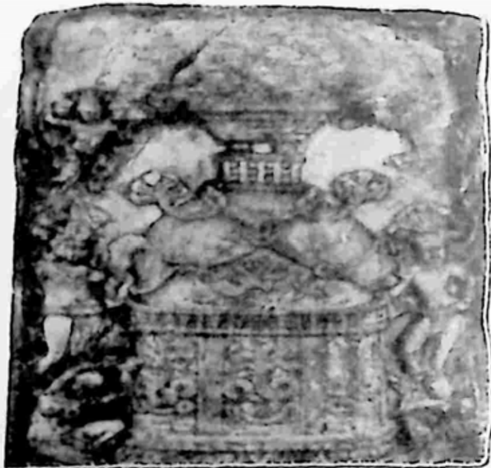
ပုံ ၁၁။ စေတီဌာပနာ ထိပ်ဖုံးကျောက်ပြား။ အမရာဝတီ၊ အေဒီ ၂ ရာစု။

(ပုံ ၁၀) စသော ဒေသများတွင် ကျောက်တောင်နံရံကို ထွင်းဖောက်ပြုပြင်ထားသော ကျောင်းသင်္ခမ်းများသည်လည်းကောင်း တခမ်းတနား ဖြစ်ထွန်းခဲ့လေသည်။ ထိုမျှမကသေး၊ အိန္ဒိယတောင်ပိုင်းမှ အန္တရမင်းတို့လက်ထက်၊ အမရာဝတီဒေသတွင်လည်း ထူပါအများ (ပုံ ၁၁) ကို တွေ့နိုင်လေသည်။