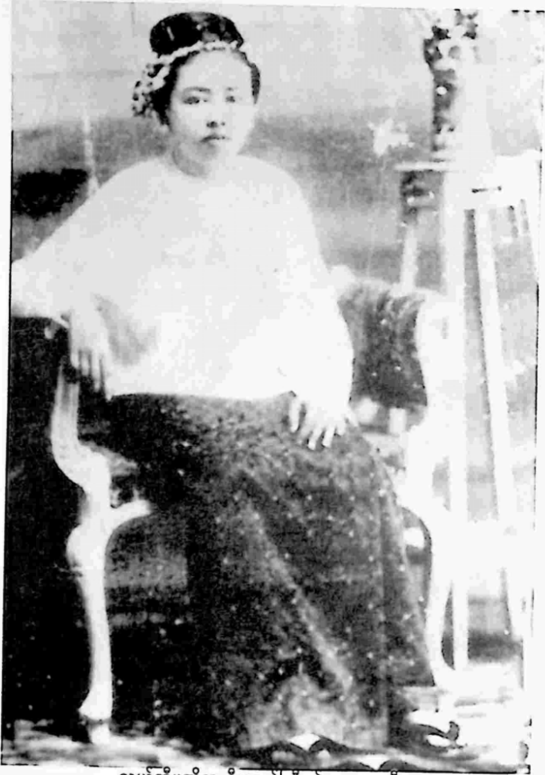
လယ်တီပဏ္ဍိတ ဦးမောင်ကြီး၏ ပထမ ဇနီး