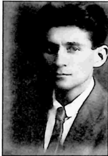
ဖရန့်စ် ကာဖကာ

ဖရန့်စ် ကာဖကာ (၁၈၈၃-၁၉၂၄) ကို ပရော့ဂျီယာ ဂျူးလူမျိုး မိဘနှစ်ပါးက မွေးဖွားပေးခဲ့တယ်။ သူ့ရဲ့ ဝတ္ထုတို တွဲ တချို့ကို သူ သက်ရှိထင်ရှား ရှိနေစဉ်မှာ ထုတ်ဝေခဲ့ပြီး သူ့ရဲ့ ဝတ္ထုရှည်တွေဖြစ်တဲ့ The Trial, The Castle, Amerika တို့ကို သူ ကွယ်လွန်ပြီးမှ သူ့ရဲ့အယ်ဒီတာ မက်စ်ဘရော့ဒ် က ထုတ်ဝေခဲ့တယ်။ ဝတ္ထုတို အများစုကို ဆရာမြင့်သန်း က မြန်မာဘာသာသို့ ပြန်ဆိုထားပြီး၊ ကာဖကာရဲ့ စာ အရေးအသားတွေအကြောင်းကိုလည်း ကျယ်ကျယ်ပြန့်ပြန့် ဆွေးနွေး မိတ်ဆက်ပေးထားတယ်။ ဘုန်းမြင့် (မန္တလေး) လည်း ဘာသာပြန်ထားတာ ရှိပါတယ်။ ဝတ္ထုရှည်တွေထဲက ဆိုရင် The Trial နဲ့ The Castle တို့ကို ဆရာတင်ဦးခက်၊ ဆရာနတ်နွယ် စတဲ့ ဆရာတွေက မြန်မာဘာသာသို့ ပြန်ဆို ထုတ်ဝေထားတာ ရှိပါတယ်။