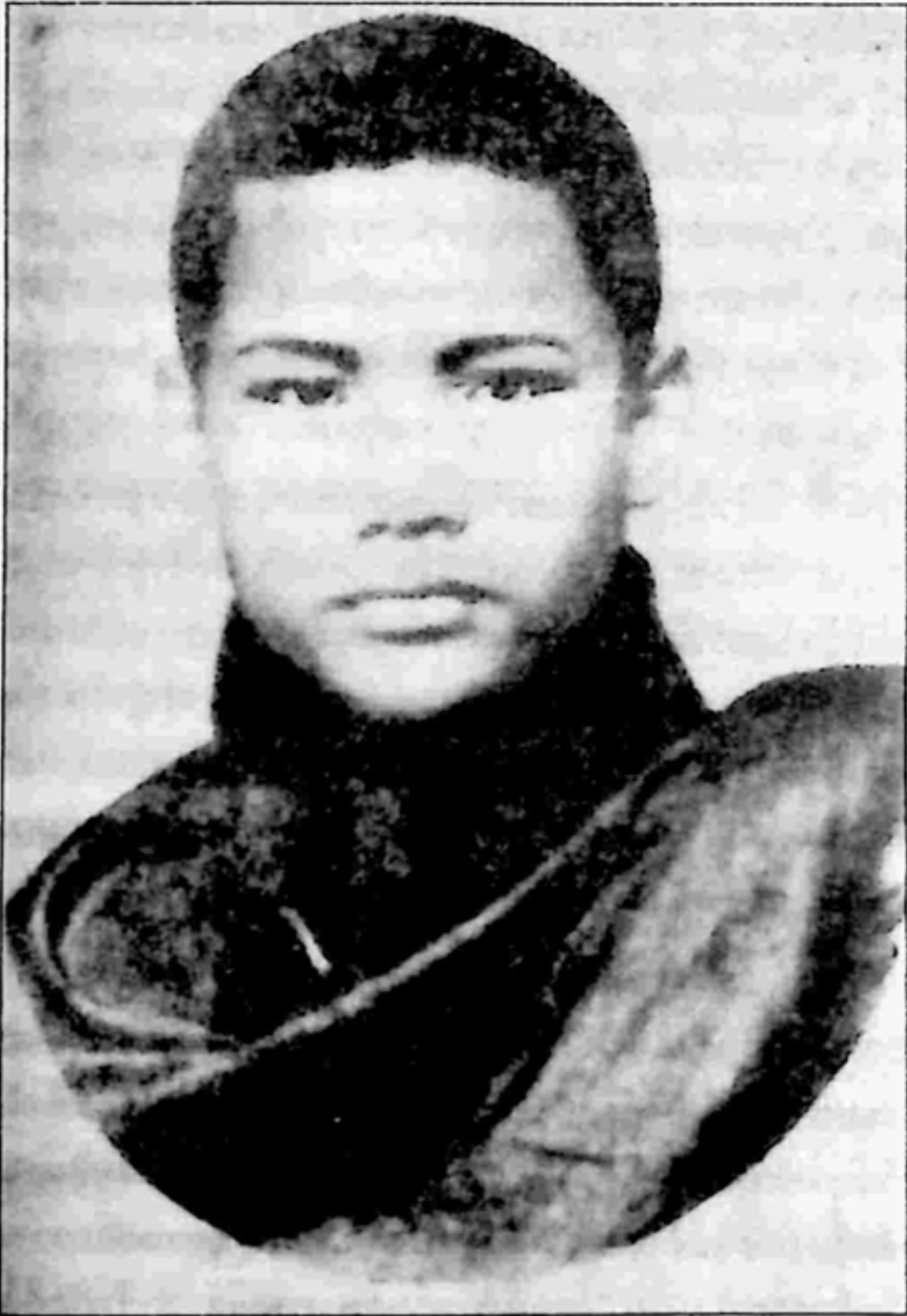
သက်တော် ၁၈ နှစ်အရွယ် ကိုရင်ဇေက

အတု ကိုရင့်ဆီကို ရောက်လာတယ်။ မစ္စရိယစိတ်နဲ့လုပ်တာ ဖြစ်မှာပေါ့။ အဲဒီတုန်းက ပလိပ်မှာ ငှက်ဖျားကြောက်ရတယ်လို့ ပြောကြပါတယ်။ အားလုံးကပဲ ငှက်ဖျား ဖျားကြလို့ ဗျင်းကလေးရွာ ဆရာနှစ်ဆေးကို သောက်ကြရတယ်။ သူ့ဆေးက ကွီနိုင်မပေါ်ခင်က ငှက်ဖျားပြတ်ဖို့ အစွမ်းဆုံး ဖြစ်ပါတယ်။ ဆေးပညာမှာ ဆရာနှစ်က တောင်သာဂိုဏ်းက ဖြစ်ပါတယ်။ အဲဒီ ဆရာဆီက ဆေးပညာတောင် နည်းနည်း သင်ခဲ့ပါသေးတယ်။ ကန့်ကလာကို ပြုတ်သောက်ရင် ငှက်ဖျား ပျောက်တယ်။