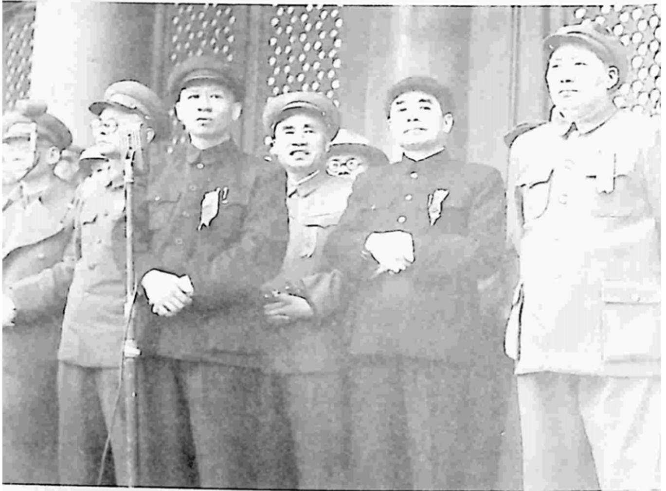
(ဝဲ မှ ယာ) လျူရှောက်ချီ၊ ချူတေး၊ ချူအင်လိုင်နှင့် မော်စီတုန်း (၁၉၅၀ ပေဒေးဝန့ အခမ်းအနား)