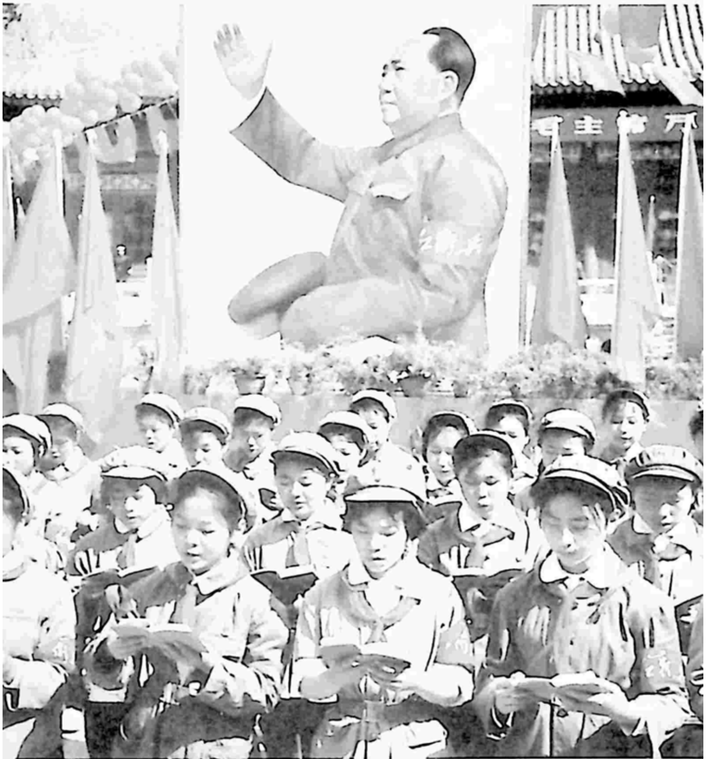
မဟာ ပစ္စည်းမဲ့ ယဉ်ကျေးမှု တော်လှန်ရေး ကာလ မော်စီတုန်း ပိုစတာ အောက်က တပ်နီ လူငယ်ကလေးများ (၁၉၆၇၊ ဇန်နဝါရီ ၂၃)