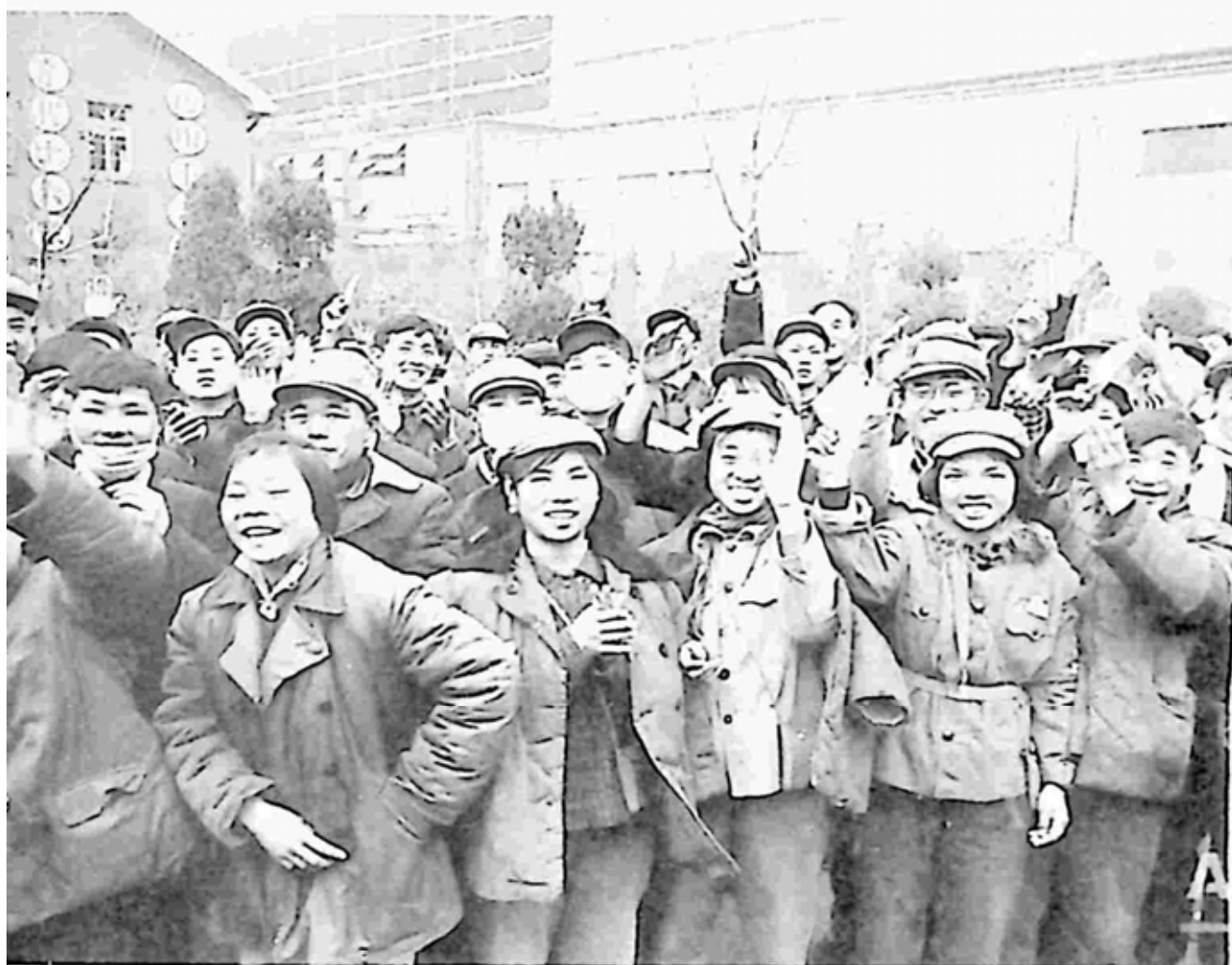
စက်ရုံ တစ်ခု၏ ရှေ့တွင် လူငယ်များ ဖော်စီတုန်း တအုပ်ငယ်များ ကိုင်ဆောင်၍ စုရုံး ဆန္ဒပြနေကြစဉ် (၁၉၆၇၊ ဇန်နဝါရီ ၂၃)