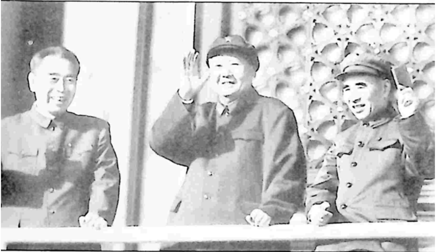
ချူအင်လိုင်၊ မော်စီတုန်းနှင့် စစ်သေနာပတိ လင်းပြောင် တီယန်ပင် ရင်ပြင်တွင် အလေးပြုခံနေစဉ် (၁၉၆၇၊ အောက်တိုဘာ)