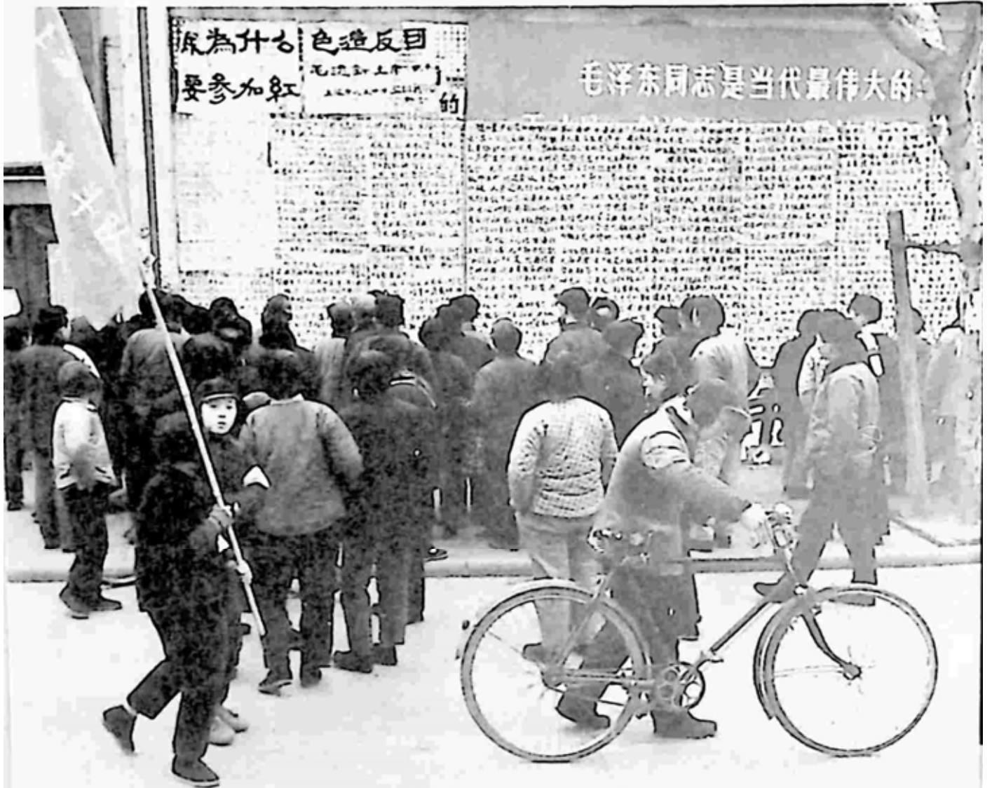
ယဉ်ကျေးမှု တော်လှန်ရေး အတွင်းက ခေတ်စားခဲ့သည့် စာလုံးကြီး ပိုစတာ