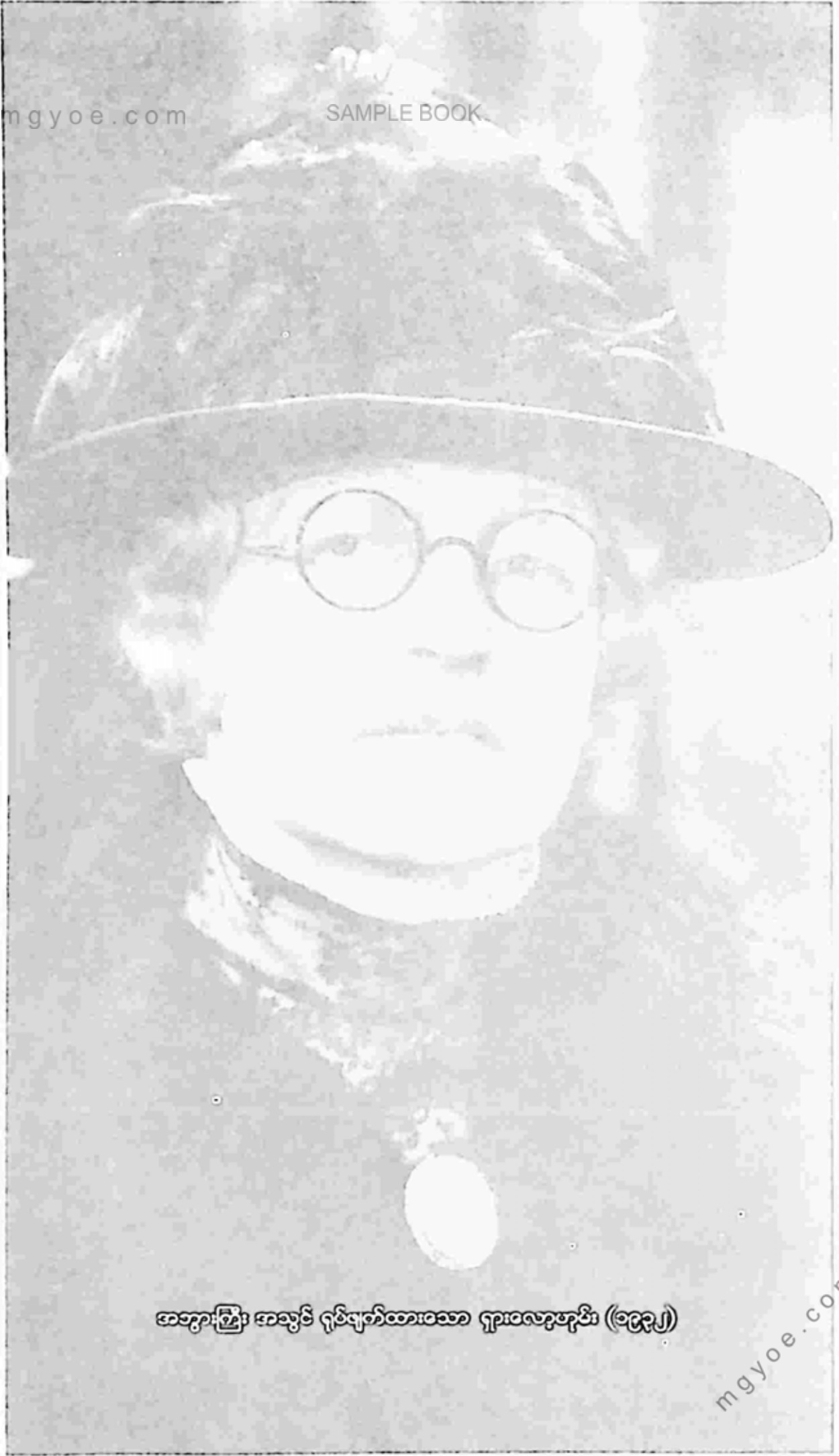
အဘွားကြီး အသွင် ရုပ်ချက်ထားသော ရှာထလှေဟုန်း (၁၉၃၂)