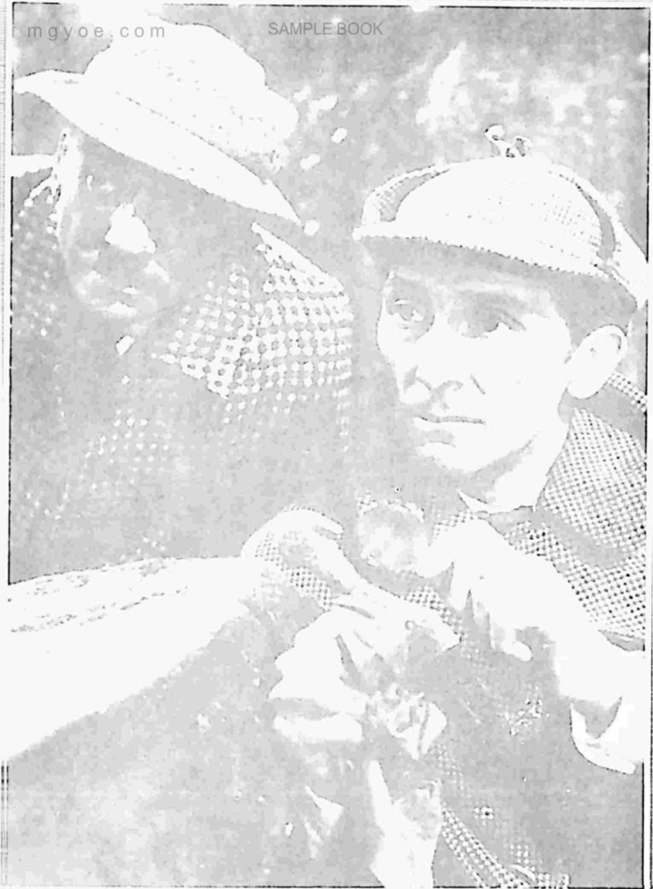
အန်ဒရေ မိုရဲလ် (ဝပ်ဆင်) နှင့် ပိတာ ကူရှင်း (ရှားလော့ဟမ်း) တို့ကို ဗာစကာဗီးလ် ခွေးကြီး ဇာတ်ကားတွင် တွေ့ရစဉ် (၁၉၅၉)