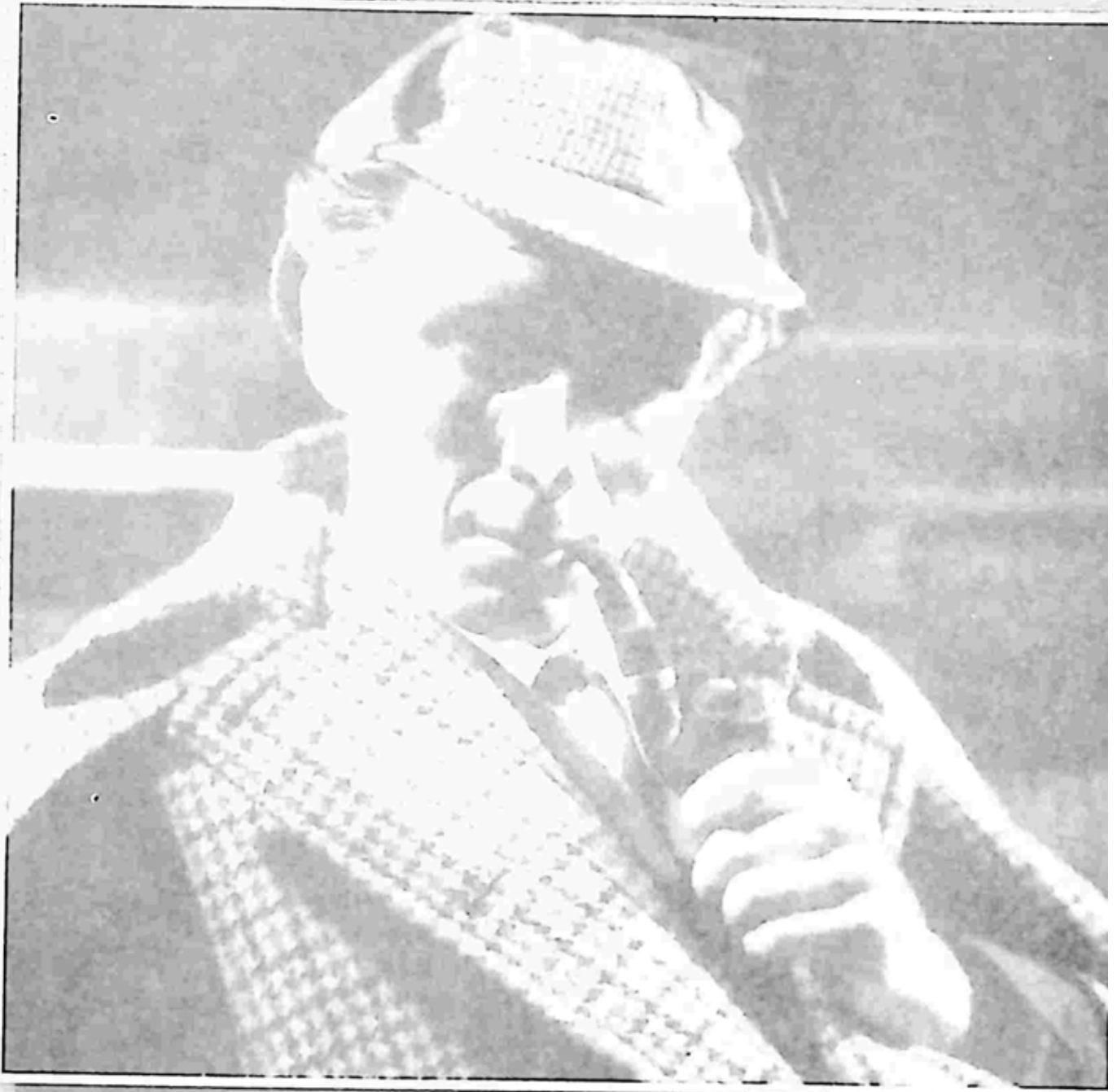
ရှားလော့ဟုမ်း သရုပ်ဆောင် တစ်ဦး ဖြစ်သူ အဲဖရက် ဘာက်