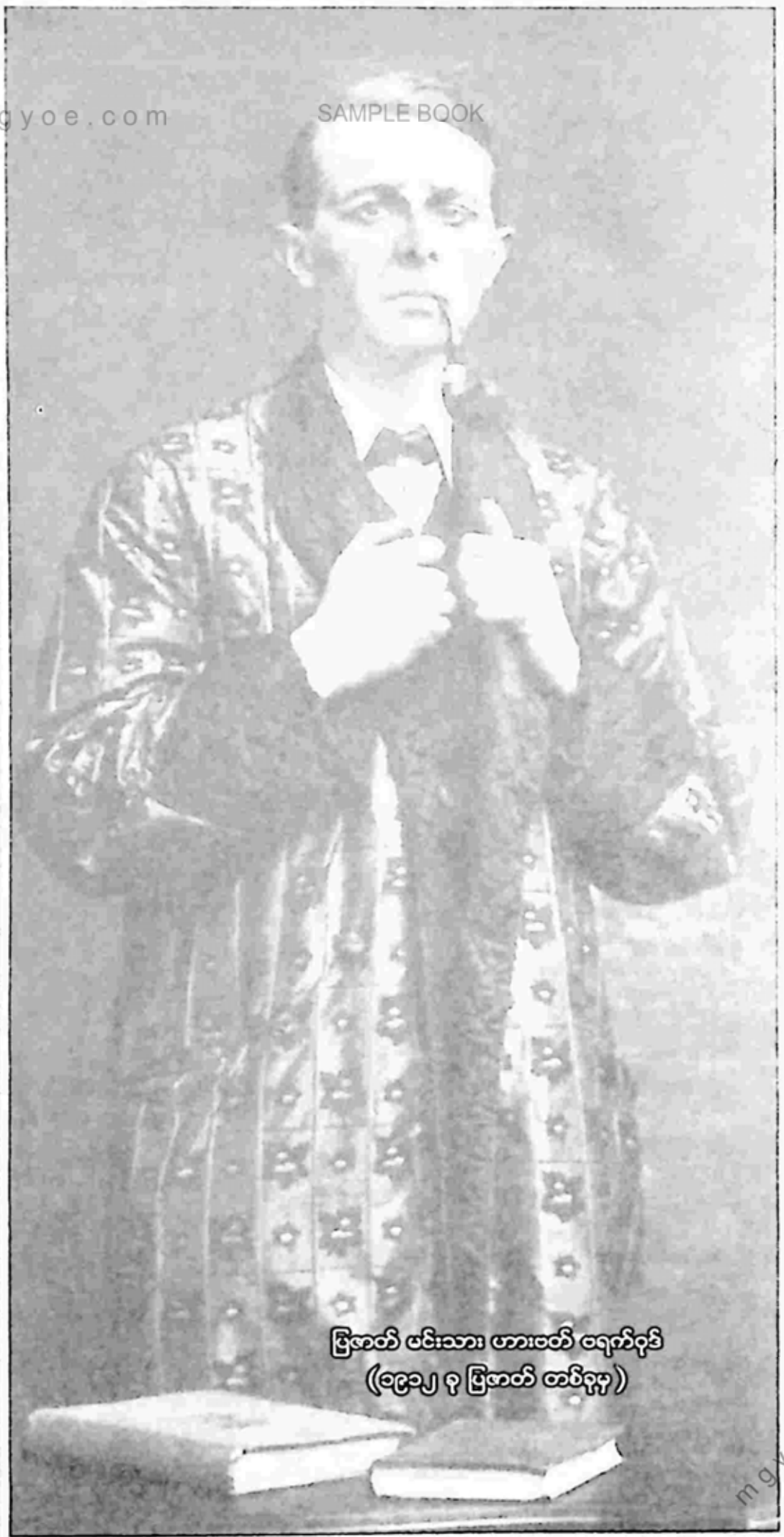
ပြုအတ် မင်းသား ဟားဇတ် ဝရက်ရစ် (ဝေဠာ့ ဝု ပြုအတ် တစ်ခု)