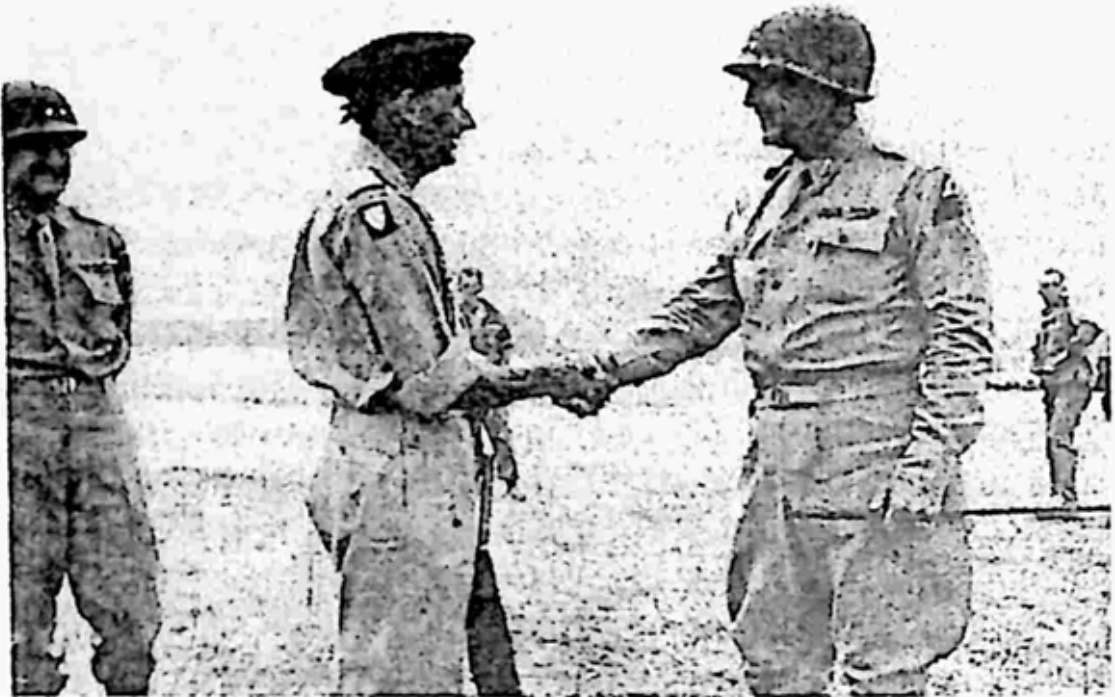
ဗိုလ်ချုပ်ကြီးပက်တန်က ဗြိတိသျှဗိုလ်ချုပ်ကြီး Bernard L. Montgomery ကို စစ္စလီစစ်မျက်နှာပါလာမိခန်းလေဆိပ်၌ နှုတ်ဆက်နေပုံ