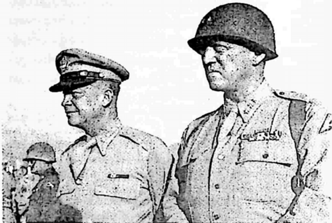
ဗိုလ်ချုပ်ကြီးပက်တန်နှင့် ဗိုလ်ချုပ်ကြီး Dwight D. Ei တို့ စစ္စလီစစ်ပျက်နာပါလာမိခန်းတွင် တွေ့ဆုံစဉ်