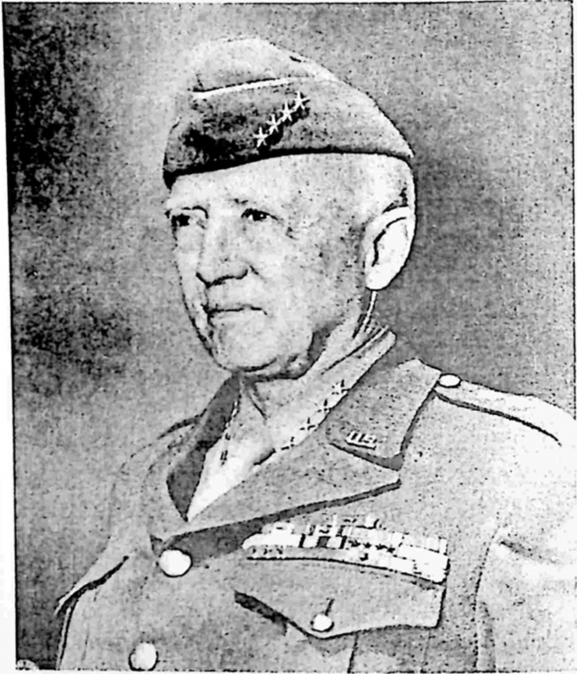
General George S. Patton Jr.