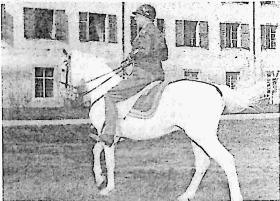
ဂျာမနီခေါင်းဆောင်ကြီး Adolf Hitler က ဂျပန်ဘုရင် Hirohito ထံ လက်ဆောင်ပေးရန် ရွေးချယ်ထားသောမြင်း Favery Africa ကို ဗိုလ်ချုပ်ကြီးပက်တန်က စီးနင်းနေစဉ်