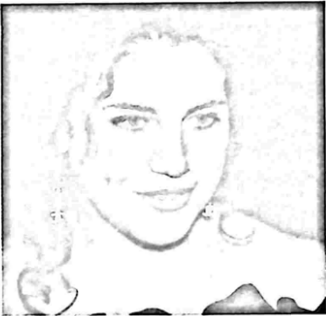
မော်နီကာ လူဝင်းစကီး

ဟီလာရီ ပြောလည်း ပြောလောက်သည်။ အထူးထောက်လှမ်းရေးအဖွဲ့မှ ကင်နီ စတားသည် ရီပတ်ဘလီကန် ဖြစ်သည်။ သူသည် Whitewater အမှု အတွက် စုံစမ်းစစ်ဆေးရန် ဒေါ်လာ ၂၅ သန်း သုံးစွဲခဲ့သည်။