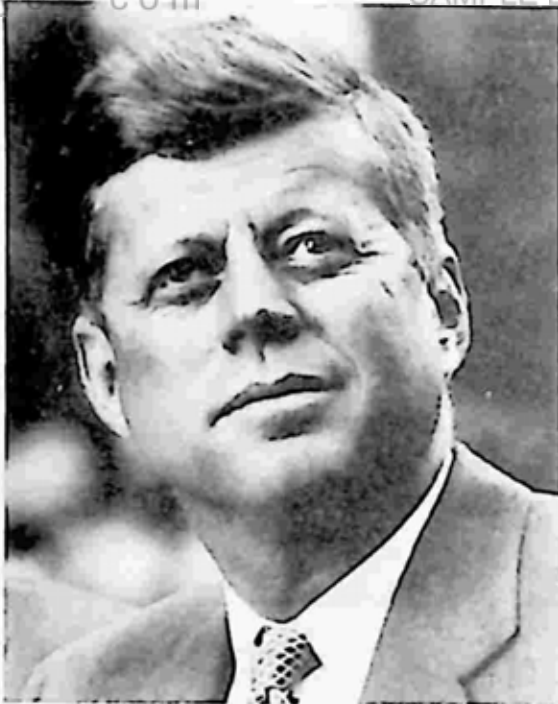
ဂျန်အက်ပ် ကနေဒီ

ကနေဒီသည် သာမန်ထက် လွန်ကဲတတ်သည့် ထူးထူးခြားခြား အလေ့အထရှိသူ ဖြစ်သည်။ ကျားဘား ဒုံးကျည်ကိစ္စ အရေးအခင်း ကာလတွင် တစ်ကမ္ဘာလုံးက နျူကလီးယားစစ်ပွဲကြီး ဖြစ်တော့မည် လောဟု စိတ်ဝင်တစား ဖြစ်ကာ စောင့်ကြည့်နေခဲ့ရသည်။ ကနေဒီသည် အိမ်ဖြူတော်အတွင်း အစည်းအဝေးခန်းမအတွင်း၌ အရေးတကြီး ကိစ္စကို ဆွေးနွေးနေချိန်ဖြစ်သည်။ ထိုအချိန်တွင် အတွင်းရေးမှူးမ လှလှလေး တစ်ယောက် အခန်းအတွင်းသို့ ဝင်လာသည်။ ကနေဒီ