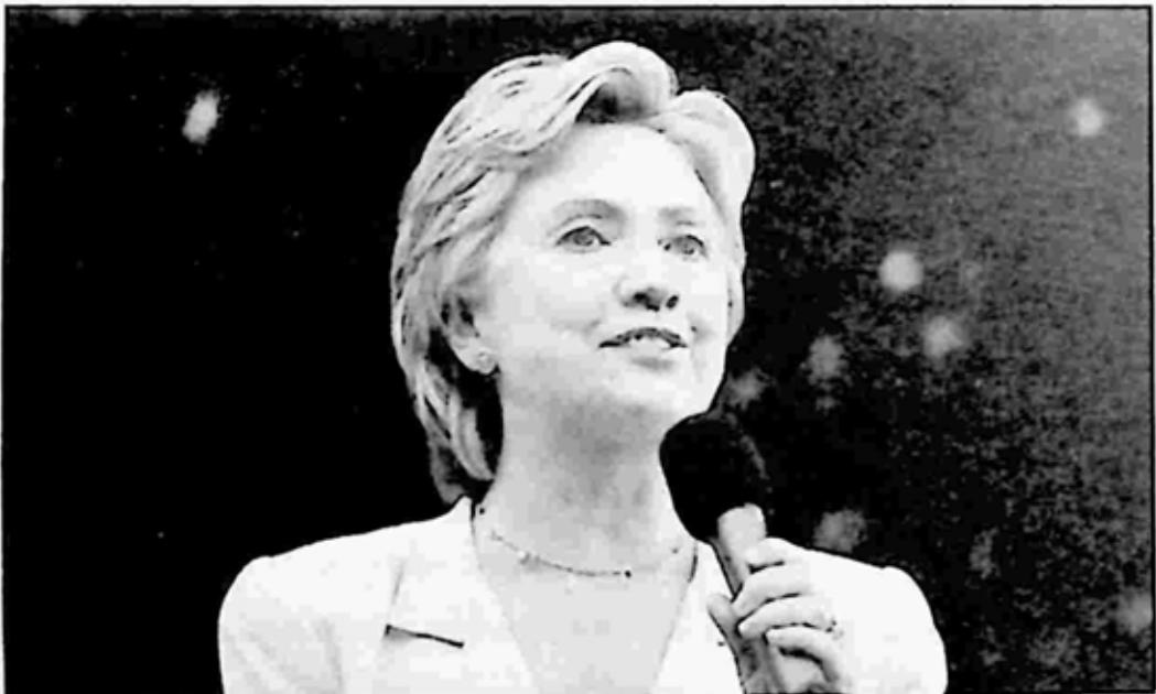
ဟီလာရီ ကလင်တန်

Blonde Power ကုမ္ပဏီ၏ အရာရှိတစ်ဦး ဖြစ်သူ ဂျန်ကင်ကမူ ကလင်တန်နှင့် သူမတွင် ဘာဇာတ်လမ်းမှ မရှိကြောင်း ငြင်းဆိုခဲ့သည်။ သို့သော် ကလင်တန်၏ ဖုန်းမှတ်တမ်းတွင် သူမထံ တစ်နေ့လျှင် ၁၁ ကြိမ် ဖုန်းဆက်သည့် မှတ်တမ်းများက သက်သေအဖြစ် ရှိနေသည်။ တစ်ကြိမ်ကဆိုလျှင် ညဉ့်နက်ချိန်မှ