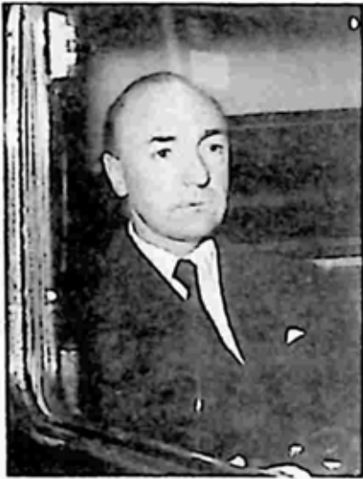
ပြဿနာများ ရင်ဆိုင်နေရသော ပရိယုမီ

ဝီလ်ဆန်ကလည်း သူ့ထံမှစာကို လက်ခံရရှိ သည်။ ထိုစာကို ဝန်ကြီးချုပ်ထံသို့ တင်ပြလိုက် သည်။ ဝန်ကြီးချုပ်က လော့ဒ် ဒေလ်ဟွန်း၏ ကြီးကြပ်မှုအောက်တွင် ကော်မတီတစ်ရပ်ဖွဲ့ပြီး စစ်ဆေးရန် သဘောတူလိုက်သည်။ ပရိယုမီ သည် ထိုအချိန်က အားလပ်ရက် ခရီးထွက်နေ ချိန်ဖြစ်သည်။ သူ ပြန်ရောက်လာချိန်တွင် သူ ကစားနေသည့်ပွဲ နိဂုံးချုပ်တော့မည်ကို သိမြင် လိုက်သည်။ သူသည် စုံစမ်းစစ်ဆေးရေးအဖွဲ့ကို ရင်မဆိုင်ဘဲ ဆက်ပြီး လိမ်လည်ထွက်ဆိုနေခဲ့ သည်။ သူက ပါလီမန် ဥက္ကဋ္ဌနှင့် ပါလီမန် အတွင်းဝန်တို့ကိုသာ တွေ့ဆုံမည်ဟု ဆိုသည်။