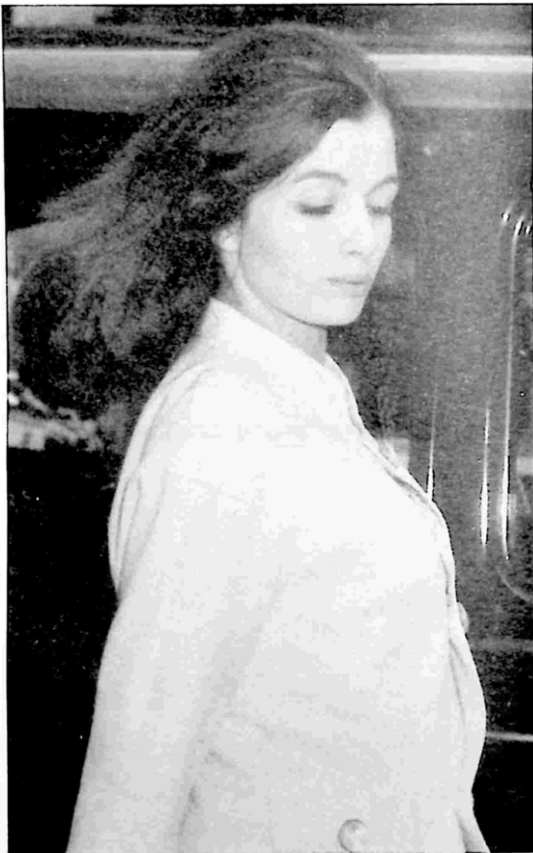
ခရစ္စတင်: ကီးလား