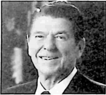
ရော်နယ် ရီဂင်

ရော်နယ် ရီဂင်သည်လည်း ရုပ်ရှင် မင်းသားဘဝတွင် တာဝန်မဲ့ခဲ့သူဟု ဆိုနိုင် သည်။ ကိုယ်ဝန်ရှိနေသည့် လက်ရှိမယား ဖြစ်သူ နန်စီကို လက်ထပ်ယူရန် စီစဉ်လိုက် ချိန်တွင် သူ့ရင်ထဲ၌ အသက် ၁၉ နှစ်အရွယ် စလင်း ဝေါတာ ဆိုသူ ရှိနေခဲ့သည်။ သူတို့ နှစ်ယောက် ဟောလီဝုဒ် နိုက်ကလပ်တွင် တွေ့ဆုံခဲ့ကြခြင်း ဖြစ်သည်။