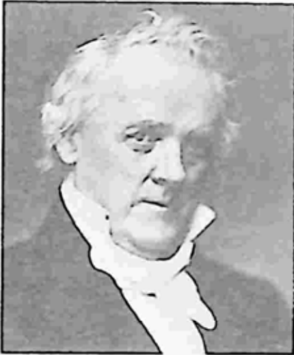
ဂျိမ်းစ် ဘူခါနန်

ဂျူလီယာနှင့် လက်ထပ်ရန်အတွက် သားများနှင့် အတော်လေး တိုက်ပွဲဆင်လိုက်ရသည်။ လက်ထပ်ချိန်တွင် တေလာက ၅၄ နှစ်၊ ဂျူလီယာက ၂၄ နှစ် ဖြစ်သည်။ ပျားရည်ဆမ်းခရီး ထွက်သည့်ကာလအတွင်း သတင်းမီဒီယာက သမ္မတကြီးကို သနားချစ်ခင်စိတ်တွေဝင်ကာ ခက်ခဲကြမ်းတမ်းသည့် အလုပ်များမှ အနားယူကာ ပျော်ရွှင်ချမ်းမြေ့စေကြောင်း ဆုမွန်တွေ တောင်းပေးလိုက်ကြသေးသည်။ သမ္မတကြီးလည်း ခေသူ မဟုတ်။ နောက်အိမ်ထောင်နှင့် သားသမီး ခုနစ်ယောက် ထပ်မံ ရရှိခဲ့သည်။