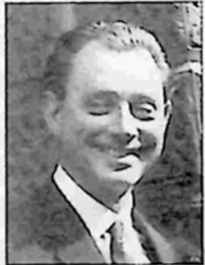
ဇာ့ဟီဖင် ဝဒ်

ခရစ္စတင်းသည် ဤဇာတ်လမ်းကို ယခင် လောဘာပါတီမှ ဝန်ကြီးနှင့် ပါလီမန်အမတ်ဟောင်းဖြစ်ခဲ့သူ ဂျန် လူးဝစ်ကိုလည်း သွားပြောပြသည်။ လူးဝစ်သည် ဝဒ်ကို ကြည့်မရသူလည်း ဖြစ်သည်။ ထိုသတင်းများသည် လူးဝစ်မှတစ်ဆင့် လက်ရှိ လောဘာပါတီမှ ဝန်ကြီးဖြစ်နေသူ ဂျော့ ဝစ်ထံ ရောက်သွားသည်။ ဂျော့ ဝစ်သည် လွှတ်တော်