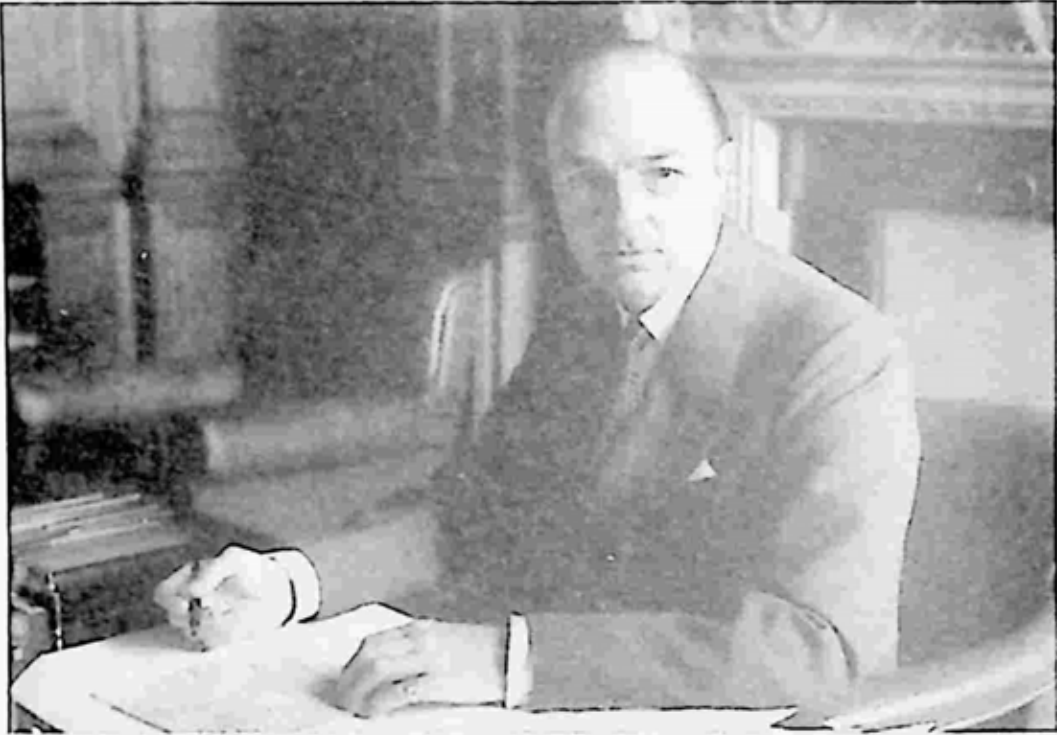
ဗြိတိန် ကာကွယ်ရေးဝန်ကြီး ဂျွန် ပရီဖူဗို

အထက်ပိုင်းဗလာအကမယ်အလုပ်များကိုလည်း ဆိုဟိုနယ်ရှိ မော်ရေး၏ ကက်ဘာရေး ကလပ်တွင် တစ်ပတ် ၈.၅၀ ပေါင်ဖြင့် ဝင်လုပ်သေးသည်။ ထိုကလပ်တွင် သူမ သည် ကိုယ်ဟန်ပြမယ် မန်ဒီရိုက်စ် ဒေဗီစ်နှင့် တွေ့သည်။ ဒေဗီစ်သည် အသက် ၁၇ နှစ် ရှိပြီး ချောမောလှပသူ ဖြစ်သည်။ ဒေဗီစ်က ကီးလားကို သူမမိတ်ဆွေ စတီဖင် ဝဒ်နှင့် မိတ်ဆက်ပေးသည်။