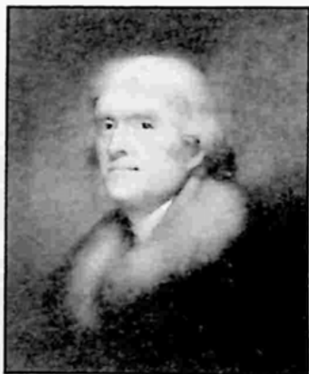
သောမတ်စ် ဂျက်ဖာဆင်

ဂျက်ဖာဆင်ကို အမေရိကန်သို့ ပြန် ခေါ်သည့်အခါတွင် ဆယ်လီကို ပြင်သစ်တွင် လွတ်လပ်သည့် မိန်းကလေးတစ်ဦးအနေဖြင့် ထားခဲ့ရန် သမီးဖြစ်သူကို တိုက်တွန်းသည်။ သို့သော် ဆယ်လီသည် ဂျက်ဖာဆင်၏ သမီးနှင့် အတူ ကျေးကျွန်အဖြစ် ဗာဂျီးနီးယားသို့ ပြန် လိုက်လာသည်။ ဆယ်လီတွင် ထိုအချိန်က ကိုယ်ဝန်ရှိနေပြီဖြစ်သည်။ နောက်ပိုင်း ဂျက်ဖာ ဆင်အတွက် ကလေးငါးယောက်တိတိ မွေးဖွား ပေးခဲ့သည်။ ဤအကြောင်းသည် လျှို့ဝှက်စရာ