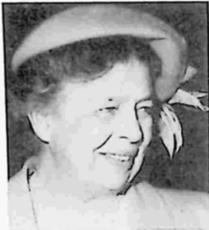
အိလီနာ ရုစဗဲ

အိမ်ဖြူတော်သို့ ရုစဗဲ ဝင်လာချိန်တွင် အိလီနာသည် မိန်းမချင်း စိတ်ဝင်စားသည့်သူ ဖြစ်သွားသည်။ သတင်းမီဒီယာက အိလီနာ၏ ထူးဆန်းသည့် အပြုအမူများကို ရေးသားလာ ကြသည်။ သူ တွေနည်းအပေါင်းအဖော်များ၊ ဆေးပြင်းလိပ်သောက်ခြင်း၊ ဝိစကီနှင့် ပလုပ် ကျင်းလေ့ရှိသည့် အေပီ သတင်းထောက် လိုရီနာ ဟစ်ကော့နှင့် အတွဲအနေ များလာခြင်း တို့သည် ထုတ်ဖော် ရေးသားစရာများ ဖြစ်လာ သည်။ အမေရိကန်တွင် စီးပွားပျက်ကပ်နှင့်