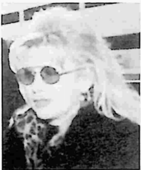
ဂျနီဇာ ဖလားဝါးစ်

The Star ကလည်း အညံ့မခံ ‘၁၂ နှစ်မြောက် ကလင်တန် အထူး ထုတ်’ဟု ဆိုကာ ထပ်မံ ထုတ်ဝေလိုက်ပြန်သည်။ ထိုသတင်းစာတွင် Little