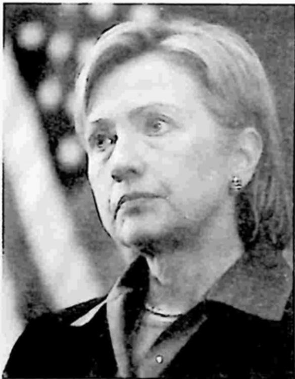
ဟိလာရီ ကလင်တန်

ကက်နက် စတားသည် FBI သို့ လင်ဒါထံမှ အချက်အလက်များကို ကြေးနန်းဖြင့် ပို့လိုက်သည်။ လင်ဒါသည် လူဝင်းစကီးကို ခရစ်စတယ်စီတီးရီ ရစ်စ် ကာလ်တန် ဟိုတယ်သို့ ဖိတ်ပြီး ကော့တေးလ် တိုက်ကာ ရင်ဖွင့်ခိုင်းသည်။ FBI မှ လူများက ပြောသမျှကို အသံလိုက်သွင်းထားသည်။ လူဝင်းစကီးသည် ပြောရင်းနှင့် သူမအပြင် အခြားမိန်းကလေး လေးဦးကိုပါ ကလင်တန်က ဖောက်ပြန် နေသေးကြောင်း ဖော်ကောင်လုပ်တော့သည်။ ထိုလေးဦးအနက် သုံးဦးသည် အိမ်ဖြူတော်တွင် အလုပ်လုပ်နေသူများ ဖြစ်သည်။ လူဝင်းစကီးက ကလင်တန်ကို ' Creep ' ဟူ၍လည်းကောင်း၊ ' El Sicko ' ဟူ၍လည်းကောင်း ခေါ်ကြောင်းအပြင် ယခင်က ဝန်မခံခဲ့ဖူးသည့် စုတ်ပြတ်သော အမှုအကျင့်တို့ကိုပါ တစ်ခုချင်း ထုတ် ဖော် ပြောတော့သည်။ FBI ကလည်း အားရရွှင်လန်းစွာဖြင့် အသံသွင်း မှတ် တမ်းတင်ထားလိုက်လေသည်။