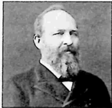
ဂျိမ်းစ် ဂါဖီးလ်

ဂျိမ်းစ် ဂါဖီးလ်တွင်လည်း လိင်တူ ချင်း ပြဿနာတွေ ရှိခဲ့ဖူးသည်။ အမေရိကန် တို့သည် ၁၉ ရာစုလောက်ကပင် လွတ်လပ်စွာ ချစ်ခင်ပိုင်ခွင့်ကို အားပေးအားမြှောက်ပြုခဲ့ကြ သည် မဟုတ်ပါလား။ သူ့နိုင်ငံရေးသက်တမ်း သည် နယူးယော့ခ် တိုင်းမ် သတင်းစာကြီးမှ အသက် ၁၈ နှစ်အရွယ် သတင်းထောက် ကလေးနှင့် ဘာဂလိုတိုတို့ ဖြစ်ပြီးနောက် အတော်လေး အသက်ဆက်လိုက်ရသည်။