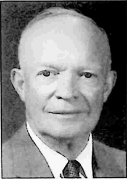
အိုင်စင်ဟောင်းဝါး

သမ္မတ အိုင်စင်ဟောင်းဝါး၏ စစ်အတွင်းကာလ ဇာတ်လမ်းလေးကလည်း စိတ်ဝင်စားစရာ ဖြစ်သည်။ သူ၏ အမျိုးသမီးကားမောင်းသူ ကေ ဆမ်းမားစ်ဘီးနှင့် ဇာတ်လမ်းတွေကို သတင်းသမားတွေက စိတ်ဝင်စားခဲ့ကြသည်။ စစ်အတွင်း ဗြိတိန်နှင့် မြောက်အမေရိက ခရီးစဉ်များတွင် အိုင်စင်ဟောင်းဝါးနှင့် ကေတို့နှစ်ယောက် ဓာတ်ပုံတွေ တွဲရိုက်ခဲ့ကြသည်။ အမေရိကန်နိုင်ငံသို့ ပြန်ရောက်ပြီး နိုင်ငံရေးလောကအတွင်းသို့ ဝင်ရောက်သည့်အခါတွင် အိုင်စင်ဟောင်းဝါးသည် သူမကို စွန့်ခွာလိုက်ရတော့သည်။