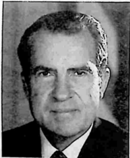
ရစ်ချတ် နစ်ဆင်

ဂျန်ဆင်ကို အနိုင်ရသွားသည့် ရစ်ချတ် နစ်ဆင်သည် နိုင်ငံရေးခြစားမှုတစ်ခုဖြစ်သည့် ဝါးတားဂိတ် အရှုပ်တော်ပုံတွင် နစ်နေရသဖြင့် သူ့လိင်ကိစ္စ အရှုပ်တော်ပုံများကို လူသိနည်းခဲ့ရသည်။ သို့သော် သူ့မဟာရန်သူကြီးဖြစ်သည့် အက်ဖ်ဘီအိုင်မှ ဂျန် အက်ဂါ ဟူးဗားကတော့ သူ့အကြောင်းကို အပ်ကျနေသည်အထိ သိထားသည်။ နစ်ဆင်သည် သမ္မတ မဖြစ်မီက ဗြိတိသျှ ထောက်လှမ်းရေးအဖွဲ့နှင့် ရုပ်ရှင်တစ်ကား ရိုက်ဖူးသည်။ ထိုကားမှာ ဟောင်ကောင်မှ တရုတ်မလေးတစ်ယောက်နှင့် လိင် ဆက်ဆံခန်း ဖြစ်သည်။ ဟောင်ကောင်မလေးက သူ့ကို ကွန်မြူနစ်အေးဂျင့် တစ်ယောက်ဟု ထင်မှတ်နေခဲ့သည်။ ထိုပုံများသည် ဟူးဗားလက်ထဲသို့ရောက်လာ