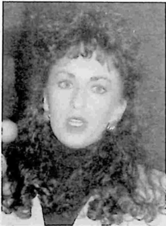
ပေါ်လာ ဂျိုးစ်

အိမ်ဖြူတော်ကလည်း ဖွင့်လိုက်သည့် အဖုံးကို သမ္မတ အရှိန်အဝါသုံးပြီး ပြန်ပိတ်ရန် ကြိုးပမ်းတော့သည်။ ကလင်တန် တရားရုံးမတက်ရရေး ကြိုးစားကြ သည်။ သမ္မတတစ်ဦး တရားရုံးလာရန်၊ မလာရန်မှာ နိုင်ငံတော် တရားရုံးချုပ်ကသာ ဆုံးဖြတ်ပိုင်ခွင့်ရှိသည်။ သို့နှင့် တရားရုံးချုပ်အမိန့်ကို စောင့်ကြရပြန်သည်။ ကလင်တန် လည်း ၁၉၉၆ ခုနှစ် နောက်တစ်ကြိမ် သမ္မတသက်တမ်းအတွက် ပြန်လည်အရွေးခံရန် အကျပ်အတည်းဖြစ်သွားရသည်။ ကလင်တန်၏ ပြိုင်ဘက် ရီပတ်ဘလီကန်မှ ဘော့ ဒိုးသည် ပေါ်လာ ဂျိုးစ်၏ စွပ်စွဲချက်များနှင့် ပတ်သက်ပြီး နိုင်ငံရေးအရ ရှေ့တန်းတင် ထိုးနှက်တိုက်ခိုက်ခြင်း မပြုခဲ့ပေ။ သူက သူ့ကိုယ်သူ ကိုသန့်ရှင်း (Mr Clean) အဖြစ် သတ်မှတ်ထားသောကြောင့်ဖြစ်သည်။ သူလည်း အိမ်ထောင်