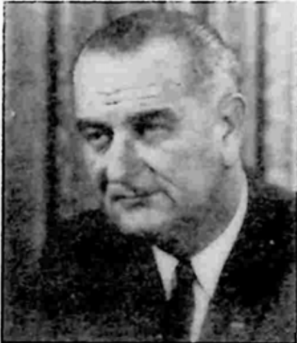
လင်ဒန် ဂျွန်ဆင်

ဂျွန်ဆင်သည် ဒီမိုကရက်တို့၏ သမ္မတလောင်းစာရင်း တင်သွင်းခြင်းမှ လက်လွှတ်ခံလိုက်ရပြီးနောက် ၁၉၆၀ ပြည့်နှစ် လော့စ်အိန်ဂျလိစ် ပါတီညီလာခံတွင် ကနေဒါသို့ လွှဲပြောင်းပေးလိုက်ရသည်။ သူ့ကို လုပ်ဖော်ကိုင်ဖက် တစ်ဦးအနေဖြင့် စာရင်းပင် မသွင်းသည့်အတွက် ကနေဒါကို အတော်လေး နာကျည်းသွားသည်။ ဂျွန်ဆင်သည် ကနေဒါနှင့် သွားတွေ့ပြီး နောက်ကြောင်းမရှင်းမှုများကို ပြောဆို ခြိမ်းခြောက်ခဲ့ရုံမျှမက ဂျူးလူမျိုးတို့ထံမှ မဲမရစေရ ဆိုသည်အထိ ပြောဆိုခဲ့သည်။ ဤသို့ဖြင့် ကနေဒါသည် သူ့ကို အရှုံးပေးကာ “လင်ဒန်၊ ကျွန်တော် ခုဆိုရင် ၄၃ နှစ်ရှိပြီ၊ ကျွန်တော် အိမ်ဖြူတော်မှာတော့ အသေမခံနိုင်ဘူး၊ ဒုတိယသမ္မတ ဆိုတာ ကလည်း သိပ်အရေးပါလှတယ်လို့ မဟုတ် ပါဘူး” ဟု ပြောဆိုလိုက်သည်။ ဂျွန်ဆင်က “ကျုပ် အမြဲတမ်း အထက်ကိုပဲ မျှော်တတ် တယ်၊ သမ္မတ လေးယောက်မှာ တစ်ယောက် လောက် အိမ်ဖြူတော်မှာပဲ သေကြရတာ၊ ကျုပ်က လောင်းကစားသမား ဆိုတော့ ဒါ ကျုပ်အတွက် တစ်ခုတည်းသော အခွင့်အရေး လို့ပဲ မြင်တယ်” ဟု ပြန်ပြောခဲ့သည်။