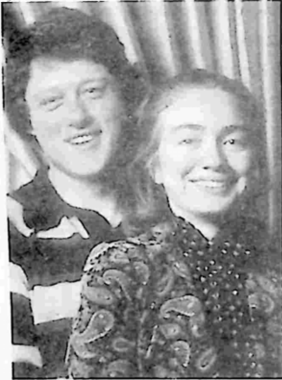
ဘီလ်နှင့် ဟီလာရီ ကလင်တန်

အတွက် ဝှက်ဖဲလေးတစ်ချပ်သဖွယ် လက်ထဲတွင် ကိုင်ထားစရာ ဖြစ် သွားခဲ့သည်။ သို့သော် ကလင်တန် ကလည်း ထိုသို့သော အဖြစ်မျိုး လုံးဝဖြစ်ခဲ့ခြင်း မရှိကြောင်း ခါးသီး စွာ ငြင်းဆိုခဲ့သည်။