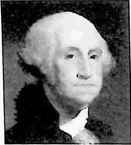
ရှော့ ဝါရှင်တန်

ဤဇာတ်လမ်းကို Boston Weekly News-Letter သတင်းစာတွင် စတင်ဖော်ပြခဲ့သည်။ ထိုသတင်းကိုပင် လန်ဒန်ထုတ် Gentleman's Magazine က ပြန်လည်ကောက်နုတ်ဖော်ပြလိုက်ရာ ဘရော့ဝေး ပြဇာတ်လောကအထိ ထိုဇာတ်လမ်းက ပေါက်သွားသည်။ ဝါရှင်တန်သည်လည်း ခေသူမဟုတ်။ မိန်းမလိုက်စားသည့်တက်တွင်အတော်လေး နာမည်ထွက်ခဲ့သူဖြစ်သည်။ သူ့ပထမအချစ်ဦးသည် အင်ဒီယန်းမလေးတစ်ဦးဖြစ်