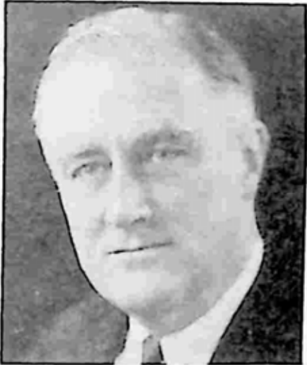
ဖရင်ကလင် ရုစဗဲ

ဖရင်ကလင် ရုစဗဲသည် အမေရိကန်သမ္မတ သမိုင်းတွင် ချောက်ကမ်းပါးပေါ် အလျှောက်ရ ဆုံး ဖြစ်မည်ထင်သည်။ သူ့ကို ပျိုတိုင်းကြိုက် သည့် နှင်းဆီခိုင် ဟူ၍ ခေါ်လေ့ရှိကြသည်။ ပထမကမ္ဘာစစ်အတွင်းက ရေတပ်ဝန်ကြီး အဖြစ် တာဝန် ထမ်းဆောင်စဉ် သူ့ဇနီး၏ အတွင်းရေးမှူးမလေးကို မြို့ဆွယ်ဖြားယောင်း ခဲ့သည်။ ဇနီးဖြစ်သူ အီလီနာက သိရှိသွား သဖြင့် တုတ်နှင့် ရိုက်သတ်မည်ဟု ခြိမ်းခြောက် သောကြောင့် သူ့အကြံကို လက်လျှော့လိုက်ရ သည်။ သို့သော် နောက်ပိုင်းတွင် ဇနီးမသိ အောင် ထိုမိန်းကလေးနှင့် တောက်လျှောက်တွဲနေခဲ့သည်။