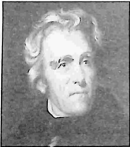
အန်ဒရူး ဂျက်ဆန်

၁၈၂၈ ခုနှစ် ရွေးကောက်ပွဲကာလအတွင်းမှ အန်ဒရူး ဂျက်ဆန်၏ နောက်အိမ်ထောင် ဇာတ်လမ်းက ပေါ်လာခဲ့သည်။ နောက်အိမ်ထောင် ပြုစဉ်ကာလအထိ ပထမဇနီးနှင့် အိမ်ထောင်ရေး ကွာရှင်း ပြတ်စဲမှုက မပြီးဆုံးသေးပေ။ ဂျက်ဆန်သည် ရှေ့နေတစ်ဦးဖြစ်သဖြင့် ထိုကိစ္စကို အစစ်ဆေးခံရမည်ဖြစ်သည်။ သတင်းသမားတွေကလည်း သူ့နောက်သို့ တကောက်ကောက် လိုက်ကြသည်။ သို့သော် ထိုနှစ် ရွေးကောက်ပွဲတွင် သူ အနိုင်ရသွားသည်။ သူ့ပထမဇနီး ရေချယ်သည် သူ အိမ်ဖြူတော်သို့ မတက်မီ ရှက်လွန်းသည့်စိတ်နှင့်ပင် ကွယ်လွန်သွားရှာသည်။