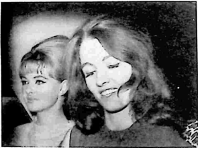
မန်ဒီ ရိုက်စ်ဒေဗီစ်နှင့် ခရစ္စတင်း ကီးလား

နိုင်ငံရေးအရ မေးခွန်းတွေ ထုတ်စရာ ဖြစ်လာသည်။ ပရိယူမိုသည် တာဝန်ရှိသူတစ်ဦး အနေဖြင့် အဘယ်ကြောင့် လိမ်လည်ထွက်ဆိုထားခဲ့ရသနည်း။ အဘယ်ကြောင့် ပါတီဥက္ကဋ္ဌကလည်း ပရိယူမိုကို သက်သက်ညာညာ လုပ်ခဲ့ရသနည်း။ ပါတီဝင်တွေက ပရိယူမိုကို လုပ်ပိုင်ခွင့်များ ရုပ်သိမ်းကာ ပါတီမှ အပြီးထွက်ခိုင်း လိုက်သည်။ လော့ဒ် ဟေးရိုန်းသည် ဝန်ကြီးအဖြစ် စာရင်းတင်ပြီးမှ နုတ်ထွက် သွားသည်။ ရုပ်မြင်သံကြားမှတစ်ဆင့် ပရိယူမို၏ လိမ်လည်ထွက်ဆိုမှုကို ပြစ်တင် ဝေဖန်သွားသည်။ ရီဂျီနယ် ပါးဂတ်တစ်ယောက်သာ ပရိယူမိုကို အကာအကွယ် ပေးနေသေးသည်။ သူက “လော့ဒ် ဟေးရိုန်းလို စိတ်နောက်ကိုယ်ပါ မထွက်သွား ကြပါနဲ့၊ ကာမဆန္ဒ ဆိုတာ လူတိုင်းနဲ့ ကင်းနိုင်ကြလို့လား” ဟု ပါးဂတ်တစ်ယောက် သာ ပရိယူမိုဘက်မှ ရှေ့နေလိုက်ပေးသည်။