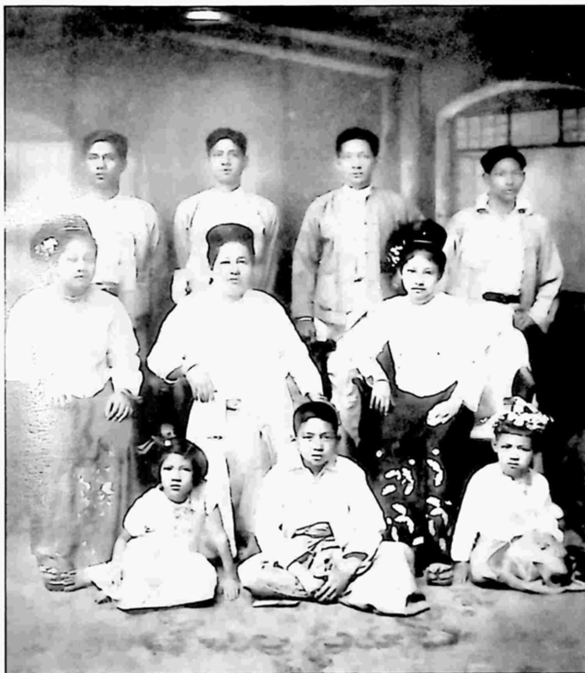
ဖေဖေတို့ မိသားစု (ဖခင်ကြီး ကွယ်လွန်ပြီးမှ ရိုက်သည့်ပုံ)