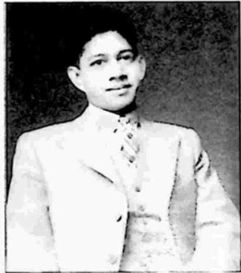
ဘိလပ်သို့ ပညာတော်သင်သွားရာမှ ရိုက်ပို့သည့်ပုံများ (၁၉၃၈-၁၉၅၀)