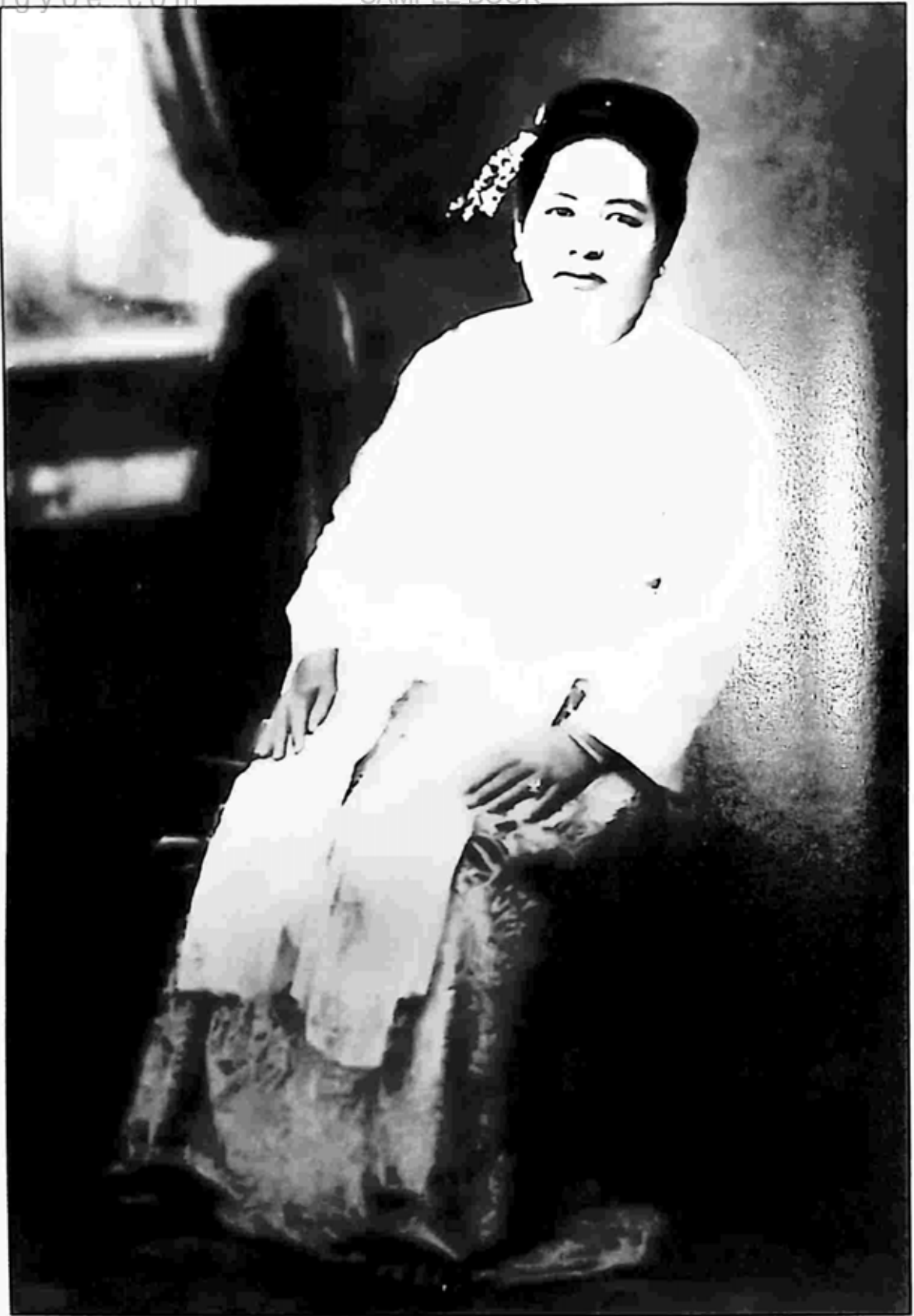
ဖေဖေ၏မိခင် ဒေါ်စိန်ညွန့်