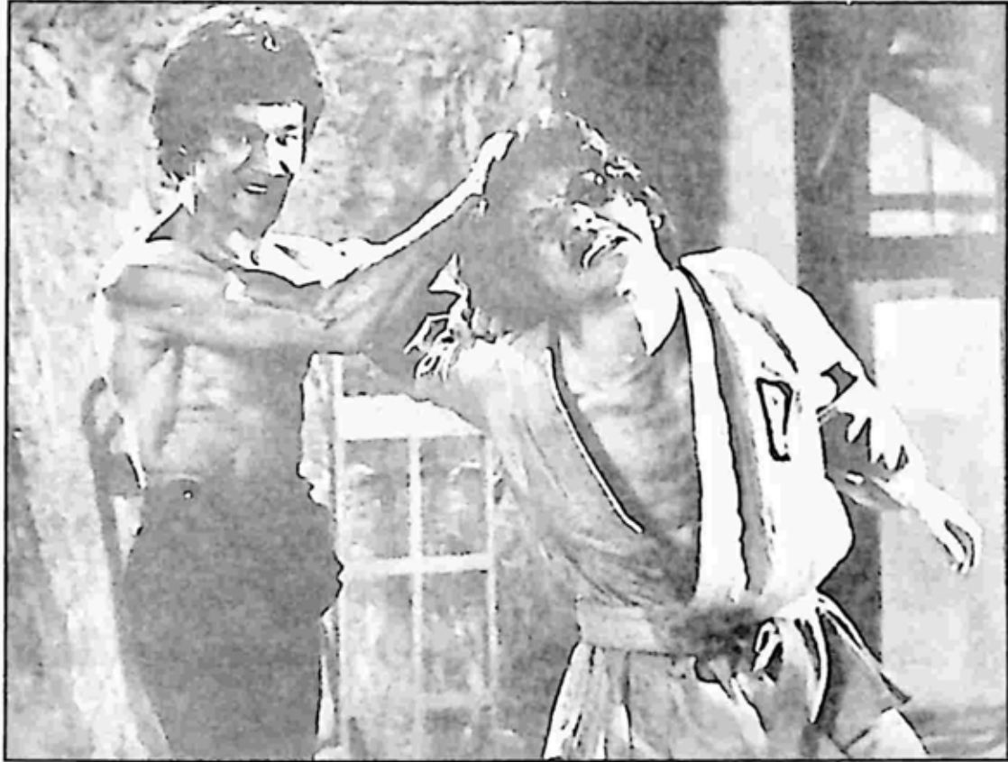
Fist of Fury ဇာတ်ကားထဲက ကျွန်တော်ဆံပင်ကို ဘရုစလီဆွဲလိုက်တဲ့အခန်း

ရိုက်ကွက်တစ်ခုက ဘရုစလီနဲ့ လူအများချကြရတယ်။ နံချပ်ကူနှစ်ချောင်းနဲ့ “ဖျပ်ဖျပ်ဖျပ်” ဆိုပြီးချတယ်။ ကျွန်တော်က အချခံရတဲ့လူအုပ်ထဲက နောက်ဆုံးတစ်ယောက် ဖြစ်နေပြန်တယ်။ ရိုက်ကူးတဲ့အချိန်မှာ သူ့အမူအရာတွေက သိပ်မြန်တယ်။ ချတာ သိပ်လှတယ်။ ရှေ့ကလူတွေကိုချပြီး ကျွန်တော့်အလှည့်ရောက်တော့ ကြည့်ရတာ လူချင်း သိပ်ကပ်သွားလို့ ထင်ပါတယ်။ သူ့နံချပ်ကူတစ်ချောင်းက ကျွန်တော်ဘယ်ဘက်ပါးကို မတော်တဆထိပြီး မသဲကွဲတဲ့အသံတစ်ချက် ထွက်သွားတယ်။ ကျွန်တော်အောင့်အည်းပြီး အသံမထွက်ဘဲ လဲကျသွားတဲ့အထိ သရုပ်ဆောင်နေလိုက်တယ်။ သူက “အိုး. . .” လို့ မသိမသာ အော်လိုက်သံကို ကျွန်တော် ကြားပေမယ့် ဒါရိုက်တာက “ကတ်” လို့ မအော်ခဲ့လို့ သူ့ဆက်သရုပ်ဆောင်နေပြီး ကျွန်တော်တို့အားလုံးကို အလဲဖြုတ်ပစ်လိုက်တယ်။ အဲဒီနောက် လဲကျသွားတဲ့လူတွေကို သူတစ်ချက်လှည့်ကြည့်ပြီး ခပ်မိုက်မိုက် ထွက်သွားတယ်။