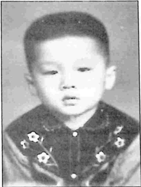
မိဘတွေက ကျွန်တော့်ငယ်နာမည်ကို အာဖောက်လို့ ပေးခဲ့တယ်။

အဲဒီတုန်းက ကျွန်တော့် မိဘတွေက ပြင်သစ်ကောင်စစ်ဝန်ရုံးမှာ ထမင်းချက်နဲ့ အစေခံ လုပ်တယ်။ မိသားစုစီးပွားရေးကြပ်တည်းပေမယ့် ကျွန်တော်က မွေးလာတာနဲ့ ဗစ်တိုးရီးယားတောင်ထိပ်က သူဌေးအိမ်မှာ နေခဲ့တယ်။ အိမ်ရှင်အိမ်က ခမ်းနားကျယ်ဝန်းပြီး ကျွန်တော်တို့အိမ်က နောက်ဖေးမှာ ကျဉ်းကျဉ်းကျပ်ကျပ် ရှိတာလေး တစ်ခုပါပဲ။ ဝိုင်းတစ်ခု