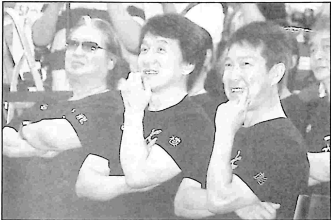
တစ်ချိန်က ယွမ်လုံ၊ ယွမ်လုတ်နဲ့ ယွမ်ပြောက် ဒီကနေ့မှာက ဟုန်ကျင်းပေါင်၊ ဂျက်ကီချန်းနဲ့ မပြောင်းလဲတဲ့ ယွမ်ပြောက်

ဘယ်နေ့မှာလဲမသိ ယွမ်ခွေ့နဲ့ ယွမ်ပြောက် သွေးသောက်ညီအစ်ကို လုပ်လိုက်ကြတယ်။ အသက်ဆယ့်သုံး ဆယ့်လေးနှစ်တုန်းက ကျွန်တော်တို့ ထိုင်ဝမ် မှာ ပွဲသွားကကြတယ်။ Yong He မြို့နယ်က ခေါင်မိုးထပ်တစ်ခုမှာ သုံးယောက်သား အရုပ်စာအုပ် ထိုင်ကြည့်ကြတယ်။ အရုပ်စာအုပ်ဆိုတာ အိတ်ဆောင်ကာတွန်း စာအုပ်လေးကို ခေါ်တာပါ။ စာအုပ်က ယွမ်ပြောက် စာအုပ်ပါ။ ကျွန်တော်ဖတ်တာ အရမ်းမြန်ပြီး အစဉ်တကျဖြစ်မဖြစ်ကိုလည်း ဂရုမစိုက်ပါဘူး။ ယွမ်ပြောက် ဖတ် ပြီးတာနဲ့ ကျွန်တော်ယူဖတ်တော့ ယွမ်ခွေ့က “ငါတို့နှစ်ယောက်က သွေးသောက် ညီအစ်ကိုလေ။ သူဖတ်ပြီးရင် ငါဖတ်အလှည့်ပဲ . . . နင့်အလှည့်မဟုတ်ဘူး။ ငါ့ကို အရင်ပေး” လို့ပြောတယ်။ ကျွန်တော်ကြားတော့ စိတ်တိုသွားပြီး သူလာလုတော့ ကျွန်တော် မပေးဘူး။ သူထပ်လုတဲ့အချိန် စာအုပ်ကို ကြမ်းပြင်ပေါ် ကျွန်တော် ပစ်ချလိုက်တယ်။ သူကောက်မယ်လုပ်တဲ့အချိန် စာအုပ်ကို ကျွန်တော် ကန်ထုတ်ပစ် လိုက်တယ်။ အဲဒီအခါ သူစိတ်တိုပြီး ကျွန်တော့်ကို လာထိုးတော့တယ်။ သူ ထိုးလိုက် တဲ့အချိန် ကျွန်တော်ရှောင်ပြီး သူ့ကိုတစ်ချက် ထိုးချလိုက်တယ်။