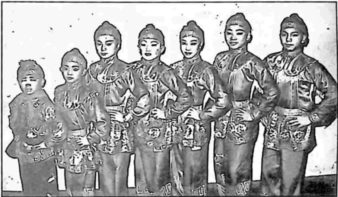
ပြဇာတ်စင်ပေါ်က ကျွန်တော်တို့တစ်သိုက်

အဲဒီနောက်ပိုင်း ပင်နီဆူးလားဟိုတယ်ရှေ့ ကျွန်တော်တို့တန်းစီဖြတ်တိုင်း အဲဒီလူတစ်အုပ်က နောက်ကို တဖြည်းဖြည်းဆုတ်ပြီး အဝေးကနေပဲ ရပ်ကြည့်ရဲ တော့တယ်။ အဲဒီအခါ ကျွန်တော်တို့က ခြေယမ်းခေါင်းယမ်းနဲ့ သူတို့ရှေ့မြောက် ကြွမြောက်ကြွ ဖြတ်ခဲ့ကြတော့တယ်။