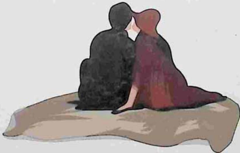
Illustrated by mar na