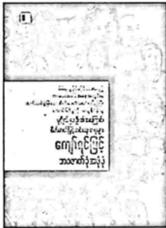
ဘဝဇာတ်ခုံအဖုံဖုံ ကျော်ရင်မြင့်

မိမိရယူပိုင်ဆိုင်ထားသည့် ဘဝပေးအခြေအနေအတွင်းမှ ထက်သန် စွဲမြဲသော စိတ်ဓာတ် အရင်းတော်ပြီး အောင်မြင်မှုကို ရယူနိုင်ခဲ့သူ ပုဂ္ဂိုလ် ၅၁ ဦး၏ အကြောင်း စိတ်ဓာတ်မြှင့်တင်ရေးစာစုများ