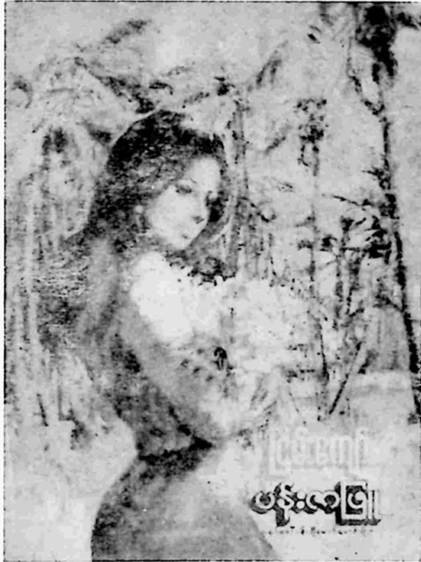
ပထမအကြိမ်ထုတ် သရုပ်ဖော်ပန်းချီ ဖောင်ဖောင်သိုက်