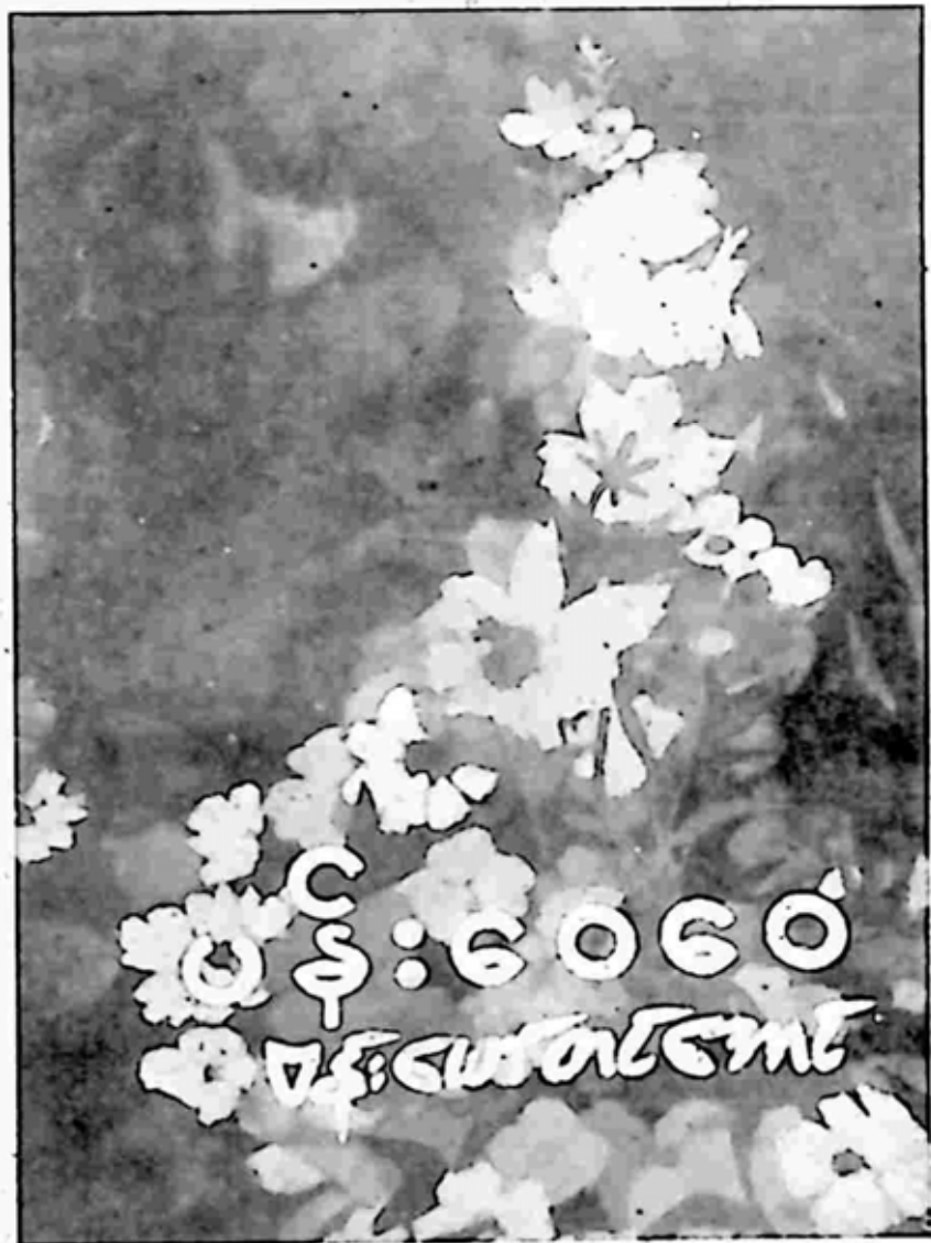
ပန်းချီ ဦးဘရင်ကလေး၏လက်ရာနှင့် ပထမအကြိမ်ထုတ် မျက်နှာပုံ။