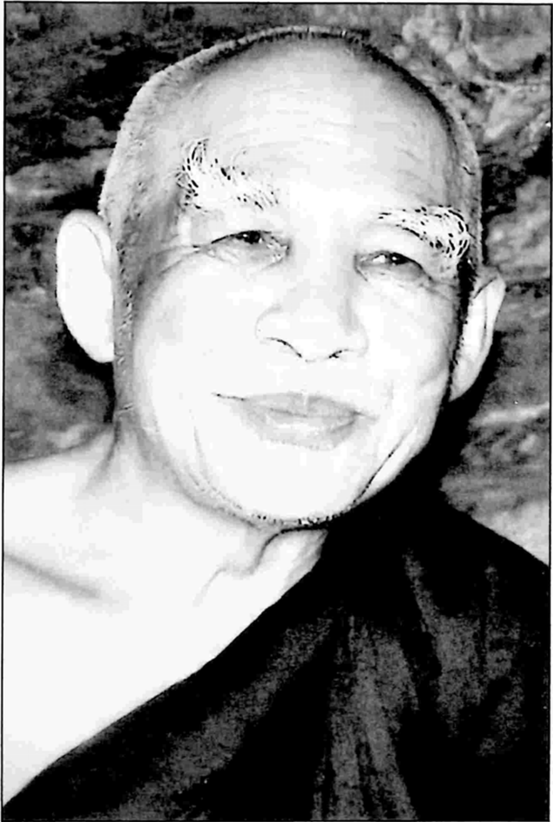
မဟာဗောဓိမြိုင်ဆရာတော်ကြီး