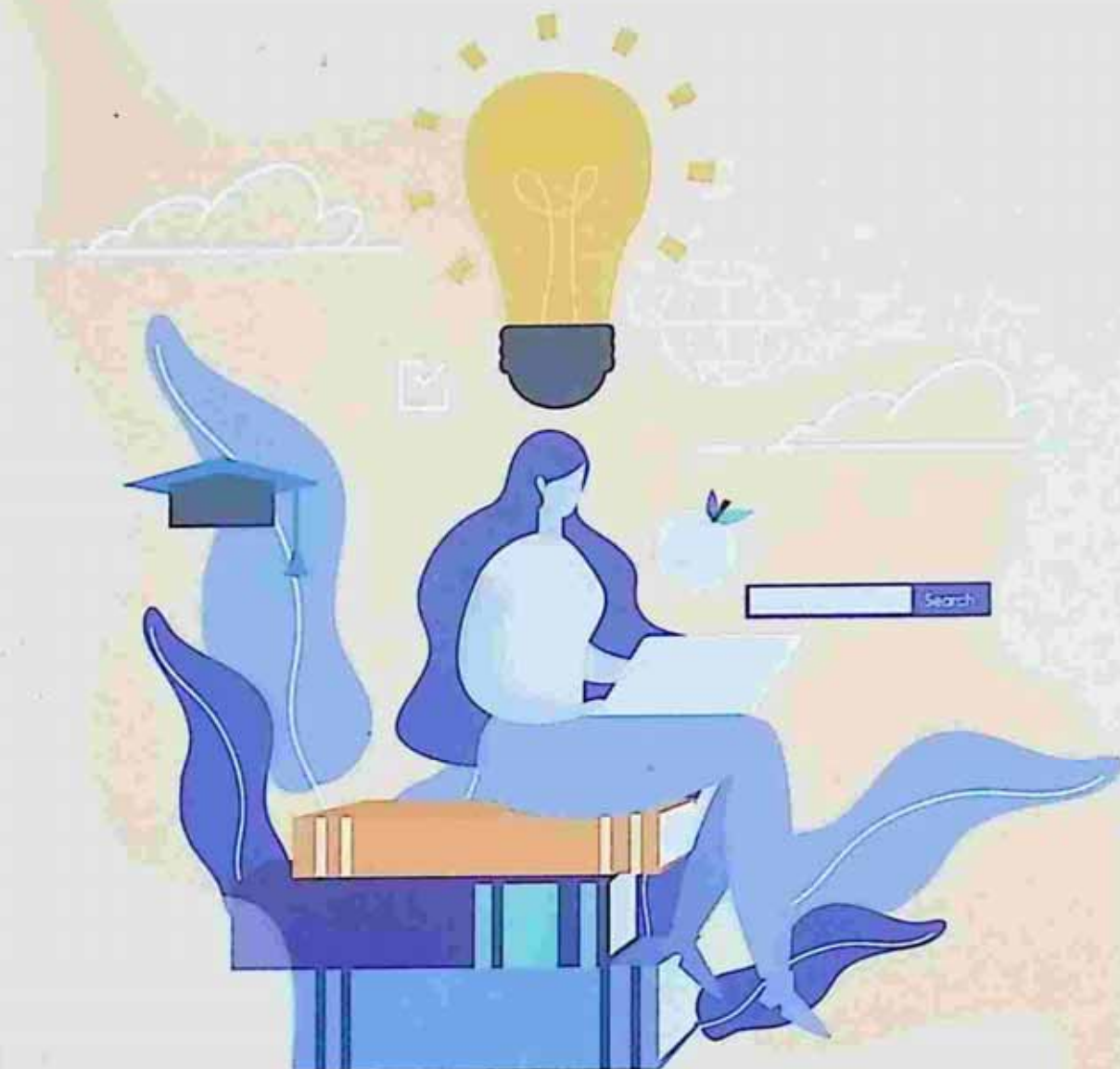
design by all free download.com

မိဘတိုင်း အုပ်ထိမ်းသူတိုင်း လူငယ်တွေနဲ့ ပတ်သက်ရမယ့်သူတိုင်း သိထားရမယ့် လူငယ်တွေ၊ ဆယ်ကျော်သက်တွေ တွေးတကာ ဒီလို