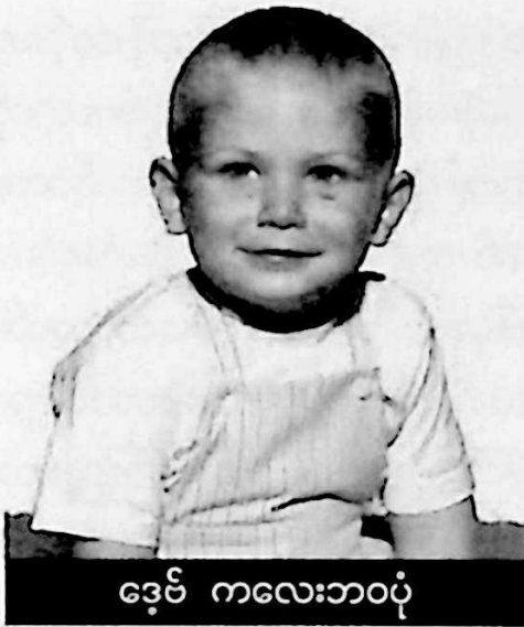
ဒေမ် ကလေးဘဝပုံ

ဖန်သားပြင်လိုကြည်လင်နေပြီး ဘလူးဂျေး ငှက်ကလေးကလည်း တခြားငှက်တွေကို မြည်တွန်တောက်တီးနေသလို နွေးထွေးတဲ့ လေညင်းက ကျွန်တော့်ဆံပင်ကိုဖြတ်လို့ တိုက်ခတ်နေပါတော့တယ်။ မီးလုံးကြီးနဲ့ တူတဲ့ နေမင်းဟာ တောက်ပတဲ့ အပြာ ရောင်နဲ့ လိမ္မော်ရောင် အစင်းကြားကြီးကို ကောင်းကင်မှာချန်ရစ်ခဲ့ကာ သစ်ပင်ကြီး တွေရဲ့နောက်ကွယ်ဆီ တိုးဝင်ကွယ်ပျောက်