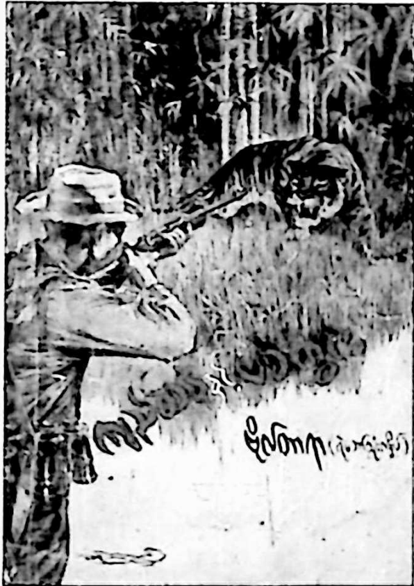
ပန်းချီဦးစန်းလွင်၏ လက်ရာဖြင့် ထုတ်ဝေခဲ့သော ၁၉၆၃၊ ပထမအကြိမ်ထုတ် မျက်နှာပုံ