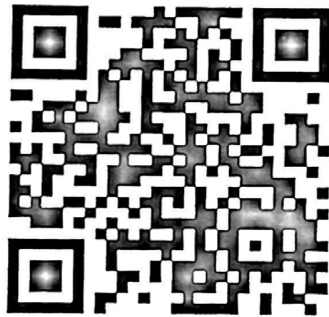
Fb Page QR