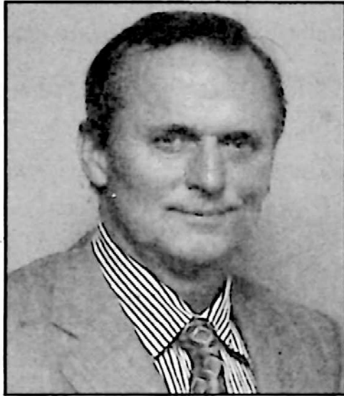
(1983-1990) John Grisham

ရွန်ခရစ်ရှမ်ကို ၁၉၅၅ ခုနှစ်၊ ဖေဖော်ဝါရီလ ၈ ရက်နေ့တွင် အမေရိကန်နိုင်ငံ၊ အာကန်ဆောပြည်နယ်၌ မွေးဖွားခဲ့သည်။ ဥပဒေဘွဲ့ရ ရှေ့နေအဖြစ်နှင့် မစ္စစ္စပီပြည်နယ်၊ ဒီမိုကရက်တစ်ပါတီဝင် လွှတ်တော်အမတ် (၁၉၈၃-၁၉၉၀) ဖြစ်လာခဲ့ရာမှ စာရေးဆရာ ဖြစ်လာသူ။ သူ ရေးခဲ့သည့် စာအုပ်ပေါင်း ၃၇ အုပ် ရှိပြီ။ ရောင်းအကောင်းဆုံး စာရင်းဝင်တွေ ပါပြီး ကမ္ဘာအနှံ့ အုပ်ရေ သန်းပေါင်း ၃၀၀ ရောင်းရသော ဟူ၏။