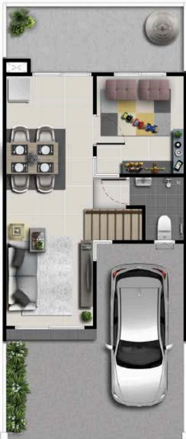
1 st FLOOR PLAN