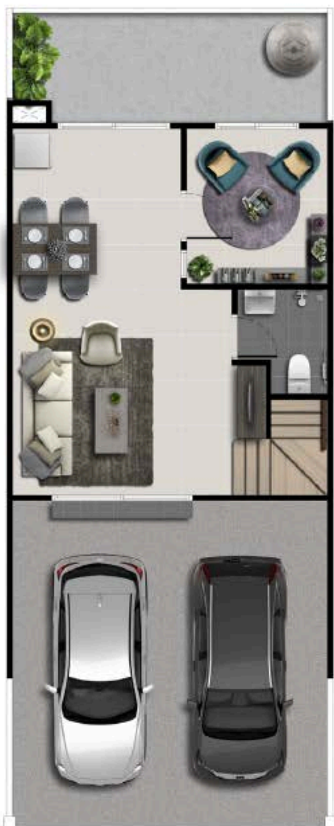
1 st FLOOR PLAN