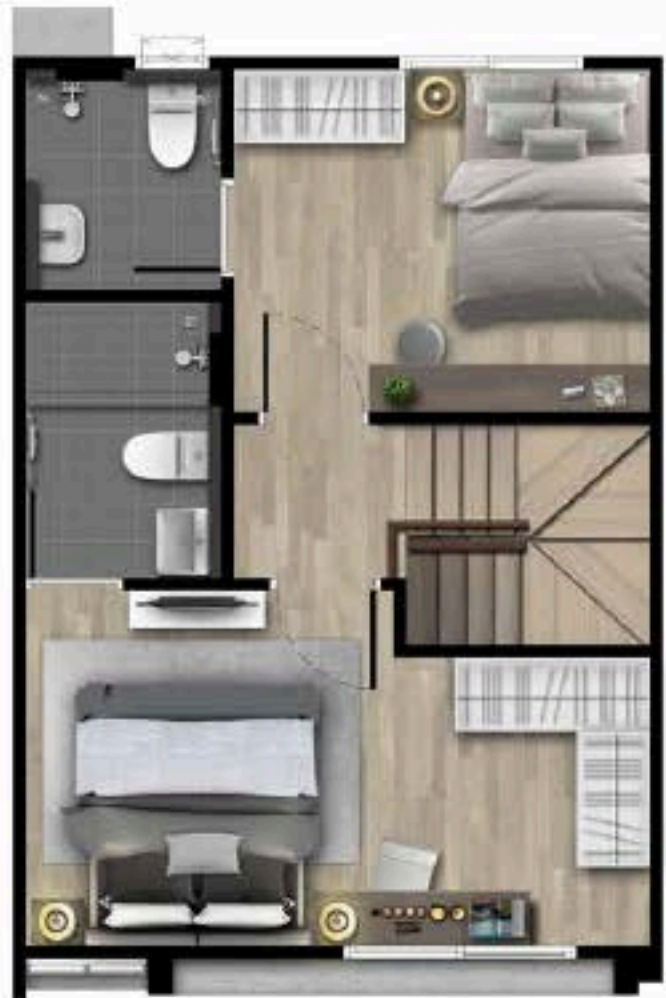
2 nd FLOOR PLAN