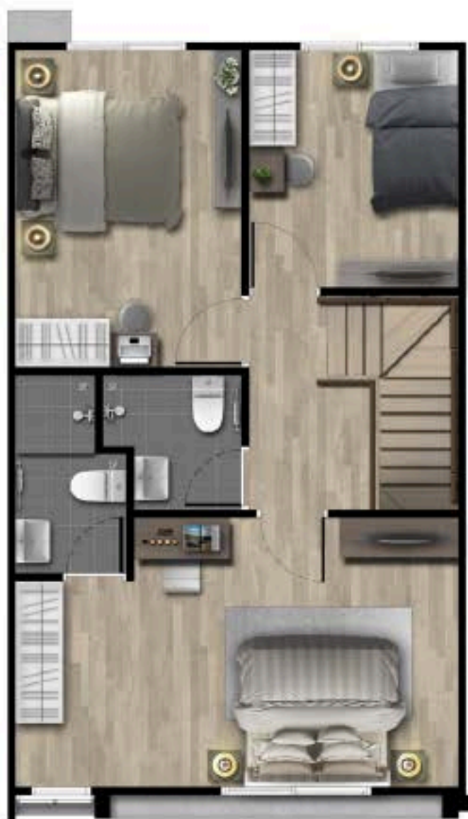
2 nd FLOOR PLAN