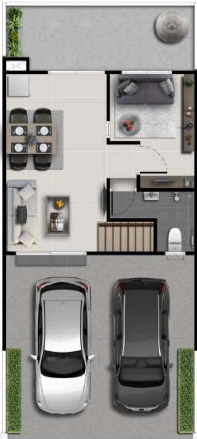
1 st FLOOR PLAN