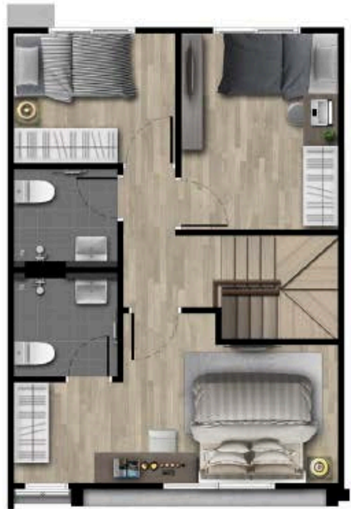
2 nd FLOOR PLAN