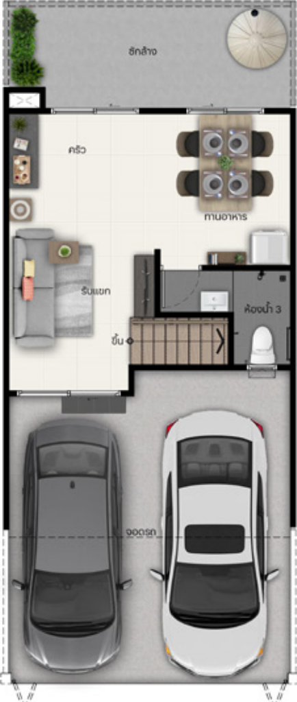
1 st FLOOR PLAN