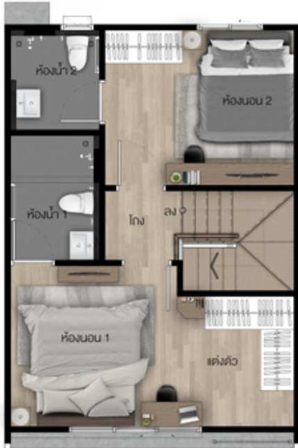
2 nd FLOOR PLAN