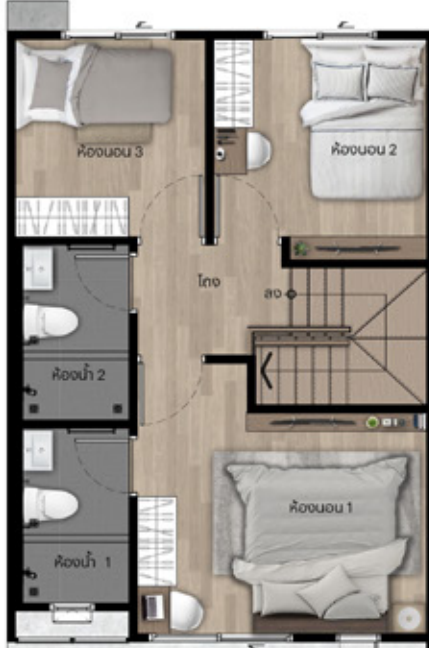
2 nd FLOOR PLAN