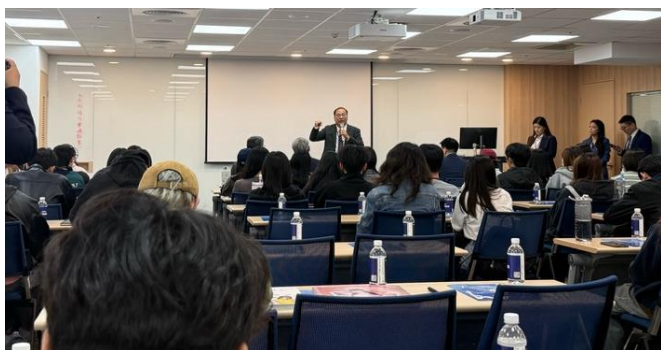
▲安聯人壽安聯區部清明副總、啟銘業務副總說明品牌精神及企業願景

這次大三學生前往安聯人壽參訪，在開場的公司介紹中，學生們對安聯的品牌精神、企業發展與壽險業的整體運作有了更清晰的認識。主管以實務角度說明企業架構與市場定位，讓學生們能將過去課堂上學到的概念與實際職場情境做連結，對保險公司的運作方式也有了更具體的了解。