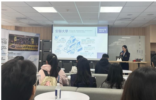
▲介紹安聯大學、HAA 百萬領袖菁英計畫