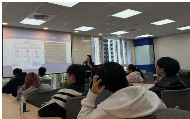
▲說明保險創新商品及理賠案例分享

這次參訪讓學生們把學理與職場實務連結起來，不僅加深對保險產業的認識，也讓他們在思考未來的實習與職涯方向時，有了更明確且具體的參考。對大三學生而言，這是一場增廣視野、理解保險產業的重要經驗。