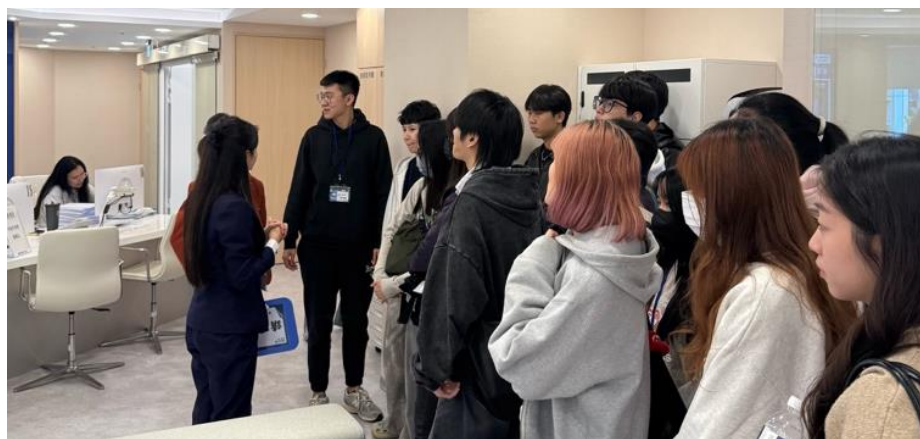
▲同學們實地參訪 AI 智能綜合櫃檯

這次參訪讓學生們把學理與職場實務連結起來，不僅加深對保險產業的認識，也讓他們在思考未來的實習與職涯方向時，有了更明確且具體的參考。對大三學生而言，這是一場增廣視野、理解保險產業的重要經驗。