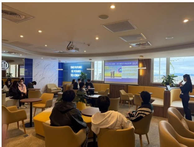
▲說明 AI 智能核保及智能理賠流程

案例分享，以真實情境呈現保險的核心價值，讓學生們更清楚商品設計與理賠服務如何在客戶需要時發揮作用。這些案例比課本內容更貼近現實，也讓學生們印象深刻。