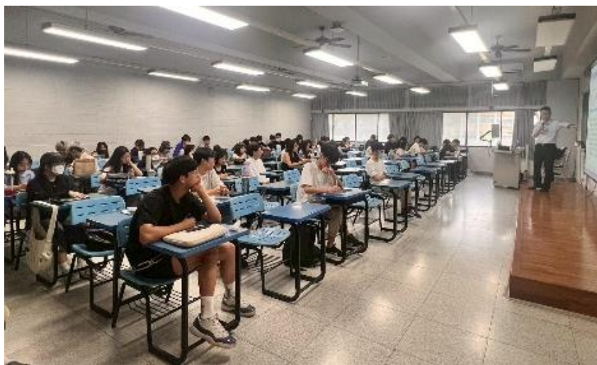
▲辛代理總經理剖析災防型保險核心價值

演講中，辛代理總經理特別提及制度的最新精進，為提升民眾權益，自 114 年 7 月 15 日起，REBI 擴大臨時住宿費用給付範圍，只要經政府機關張貼紅色危險標誌者，即可支付 10 萬元臨時住宿費用，與房屋全倒時的費用合計最高達 20 萬元。在問答互動環節，學生詢問基本保險與商業保險的差異。辛代理總經理澄清，REBI 是救急型基本保障，不承保動產或部分損失，若需更高保額或完整保障，如裝潢、傢俱，民眾應自行加保「超額」或「擴大地震保險」。他總結，本制度的成功有賴於政府、社會、個人、保險公司與地震基金這五大支柱共同運作。