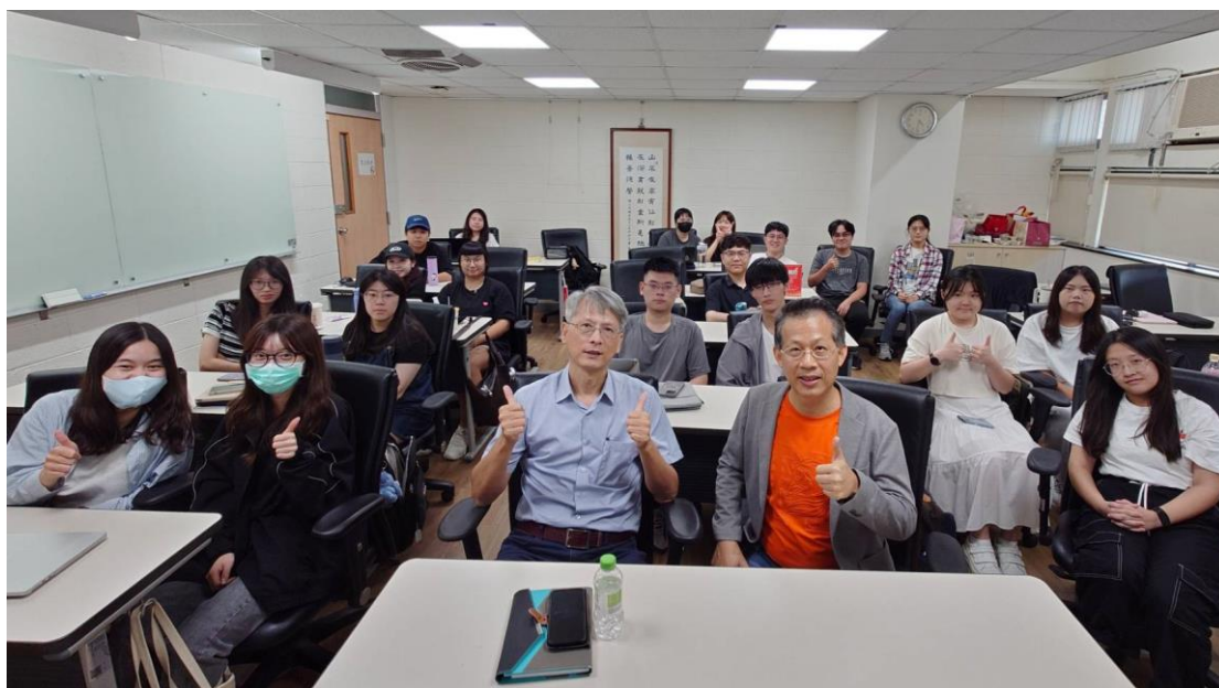
▲郭執行長(右二)、風保系張永郎主任(中)及與會師生合影

此次講座不僅讓學員收穫滿滿，也再次印證了投資教育的重要性，郭講師強調，隨著股票市場的發展及虛擬貨幣市場的快速成長，新世代投資人若能懂得風險管理、勇於學習，將有更多機會掌握財富的主動權，並在未來的金融市場中脫穎而出，他鼓勵學員從今天開始，設定目標、建立策略、建立習慣、累積知識、持續學習，趁年輕開始，才能讓複利效果最大化，讓財富自由不再是夢想，而是可以實現的目標。