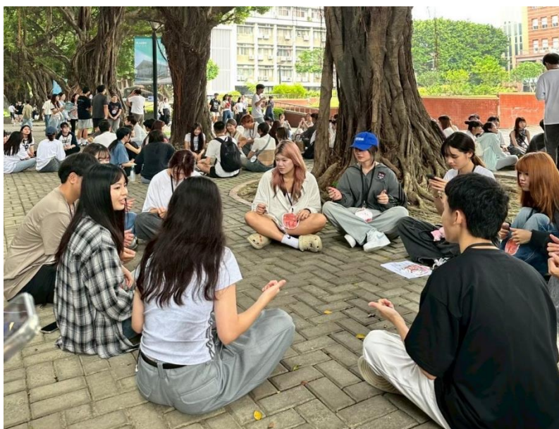
▲系學會帶領小組進行破冰活動實況

在為期三天的活動中，第一天由風保系系學會帶領教學助理團隊協力推動。上午透過破冰遊戲與分組互動，幫助新生快速融入團體並建立歸屬感，並藉由「小隊時間」加強情感交流。下午接續參與社團博覽會和社團表演，讓學生體驗到逢甲校園的多樣性文化。