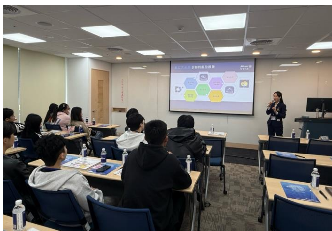
▲介紹 ESG 永續策略、綠能保險及社會責任