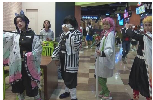
広場にはたくさんのコスプレヤが見られる

台北市的電影院裡，來了很多年輕人或帶著小朋友的全家人。也有很多穿的和電影裡出現的人物一樣服裝的人。