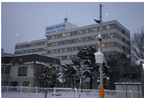
道内最大規模のクラスターが発生した旭川市の吉田病院

政府在7日的時候表示，在新冠病毒感染擴大的情況下，會針對可能無法提供醫療援助的北海道旭川市及大阪市開始調整調度自衛隊護理官支援。政府預計將接受知事正式的請求派遣，目前正在討論派遣人數。