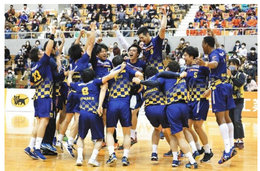
優勝を決め、喜びを爆発させる選手たち 獲得優勝 喜悅爆發的選手們

比賽接近尾聲時，巴拉斯克斯選手發揮身高優勢又攻入一球，最終以34比33反敗為勝，這是近兩年以來第二次奪冠。