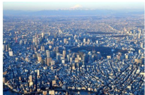
高層ビルが立ち並ぶ東京都心 東京市中心高樓大廈林立

雖然東京在文化/交流及交通/出入上已進步了許多，但經濟停滯於第四名。國內生產毛額（GDP）的成長率及確保優秀人才的排名落後是主要課題。綜合實力第五名的新加坡經濟從去年第六名變成第五名，與位於第四名的日本只有些許差距。國際金融中心的香港綜合實力度於第九名，但明年以後排名恐怕會下降。另一方面，新加坡及綜合實力排名第十的上海，有排名上升的可能性。以亞洲金融中心為目標的東京不能鬆懈。菅義偉首相的智囊竹中平蔵表示：「即使是金融中心，也有各式各樣的功能。東京在股票市場中的市值總額排名第二，同時日本也存在著大量閒置的資產。這取決於是否能策畫出針對這兩件事的政策。」